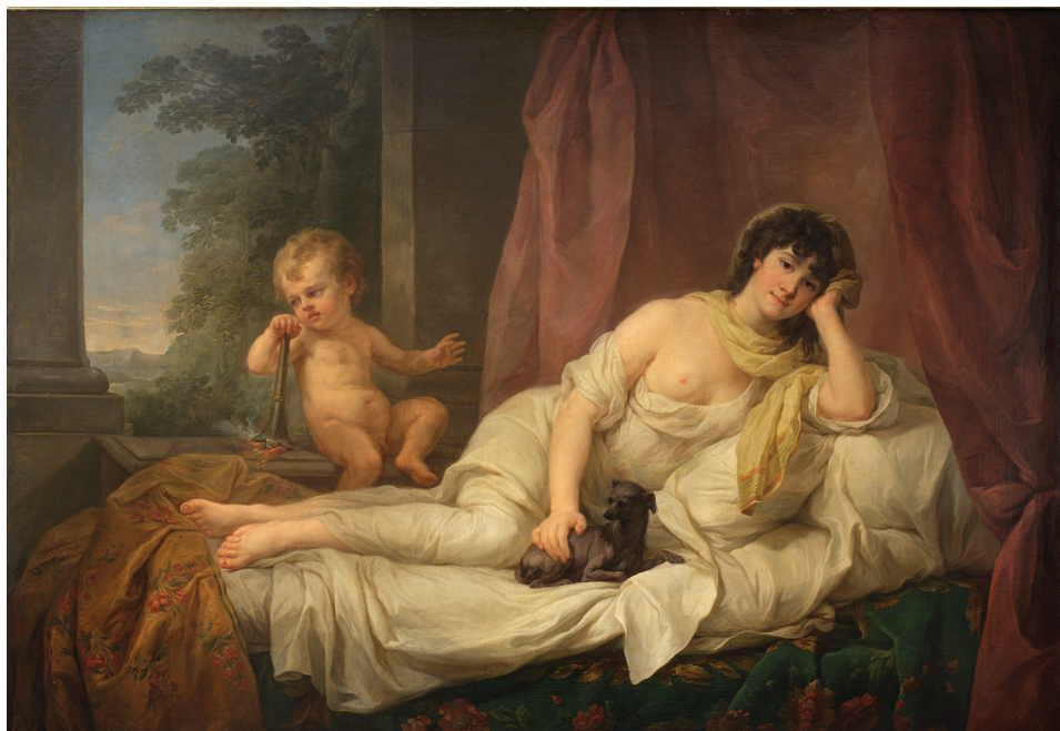
Portret Anny Lampel Marcella Bacciarellego, 1801/1802, Muzeum Narodowe w Warszawie.

Hanna Małkowska z Kozłowskich, praprawnuczka ojca sceny polskiej, przywołała w swoim pamiętniku opowieści pochodzące z rezerwuaru pamięci rodzinnej, a zapewne i ustalenia Gota, i tak w skrócie opisała relacje Bogusławskiego z Lampel: