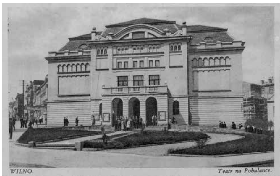
Wilno. Teatr na Pohulance, ok. 1930