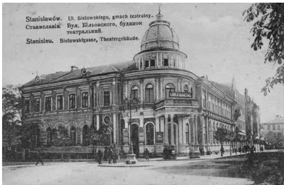
Stanisławów. Teatr Miejski, pocz. XX w.