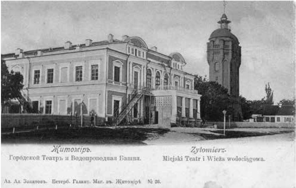
Żytomierz. Teatr Miejski, pocz. XX w.