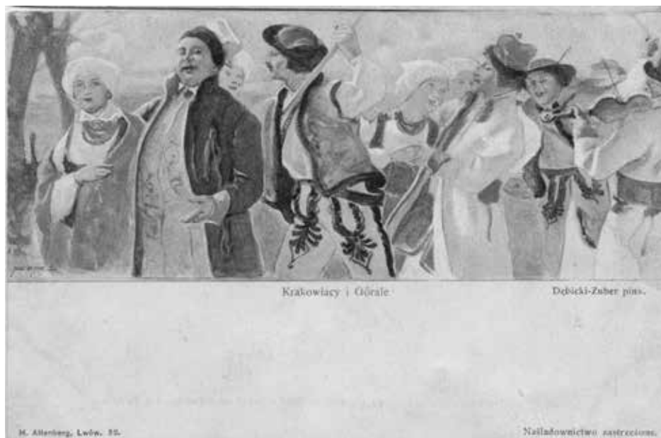
Lwów. Teatr Miejski – malowidło Aleksandra Dębickiego i Juliusza Zubera Krakowiaczy i górale