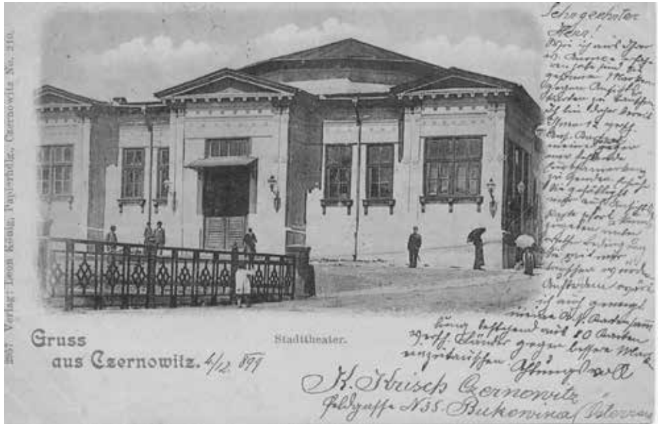
Czerniowce. Teatr Miejski, 1899