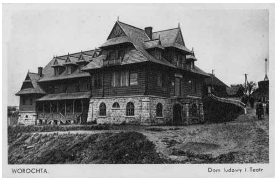
Worochta. Dom ludowy z salą teatralną, ok. 1930