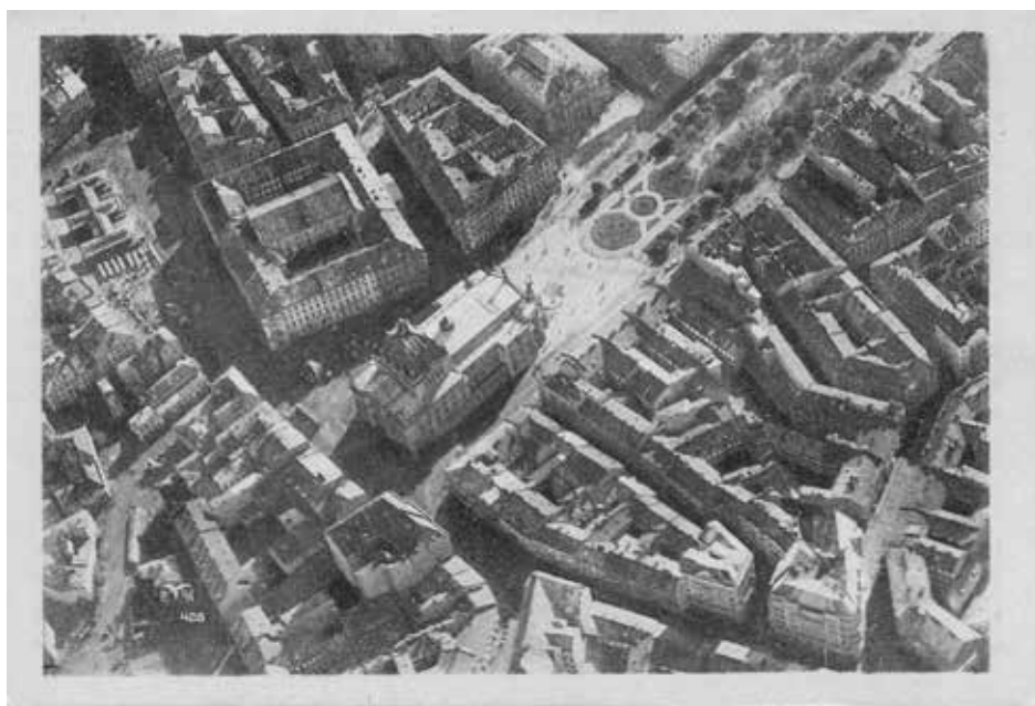
Lwów. Dawny teatr Skarbka i Teatr Miejski z lotu ptaka, ok. 1935