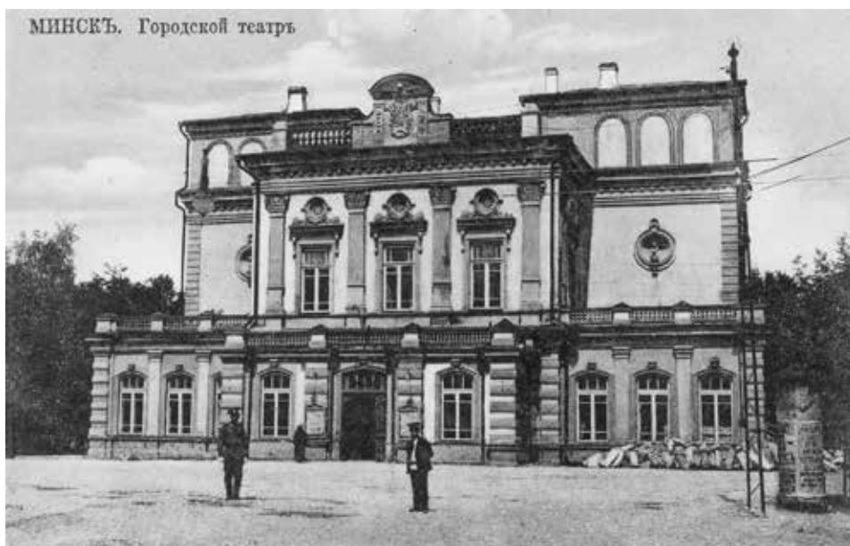
Mińsk, Teatr Miejski, pocz. XX w.