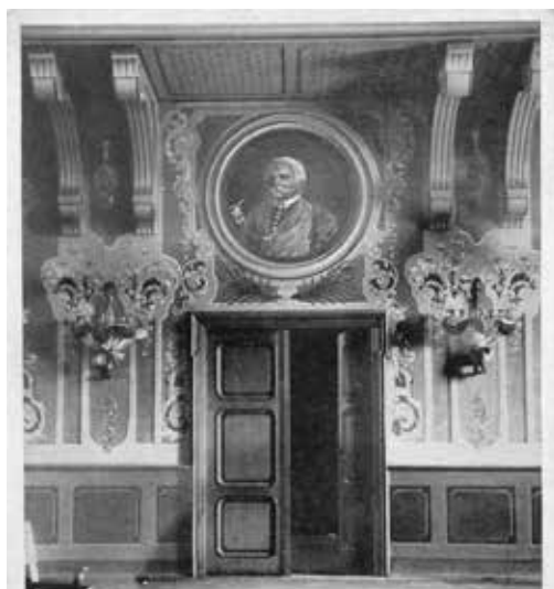
MALOWIDEA ŚCIENNE W SALI BALOWEJ I TEATRALNEJ W GMACHU KASY OSZCZEDNOŚCI W KOŁOMYI. CZĘŚĆ ŚCIANY Z PORTRETEM ALEXANDRA HR. FREDRY.