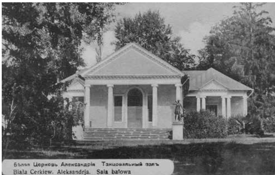
Biała Cerkiew. Sala Balowa – teatr dworski, pocz. XX w.