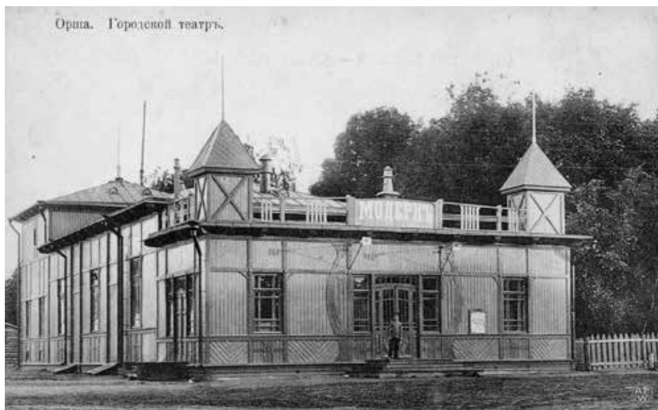
Orsza. Teatr Miejski „Modern”, pocz. XX w.