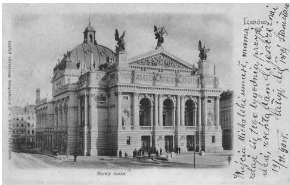
Lwów. Teatr Miejski, 1901