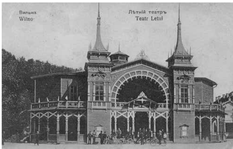
Wilno. Teatr Letni w Ogrodzie Bernardyńskim, pocz. XX w.