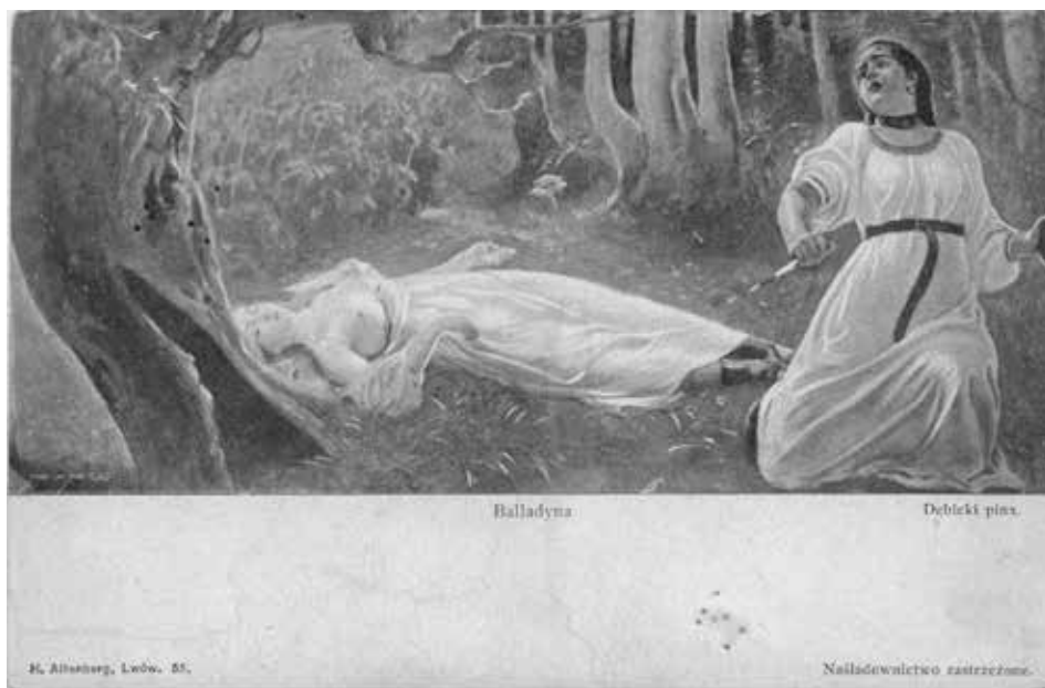
Lwów. Teatr Miejski – malowidło Aleksandra Dębickiego Balladyna