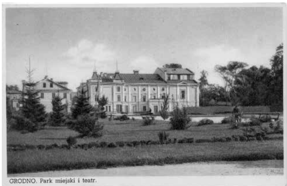
Grodno. Teatr Miejski, ok. 1930