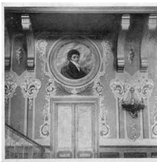
MALOWIDEA ŚCIENNE W SALI BALOWEJ I TEATRALNEJ W GMACHU KASY OSZCZED- NOŚCI W KOŁOMYI — CZĘŚĆ ŚCIANY Z PORTRETEM JANA NEPOMUCYNA KAMIŃSKIEGO.