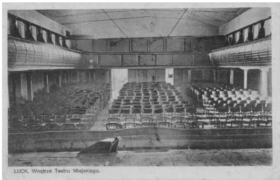
Łuck. Wnętrze Teatru Miejskiego, ok. 1925