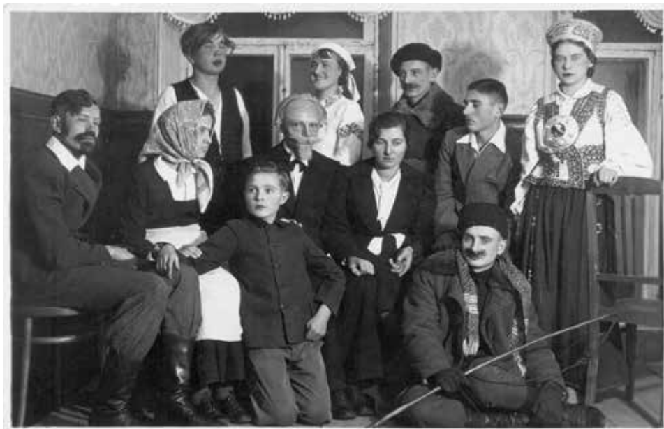
Rzeżyca. Przedstawienie szkolne w Gimnazjum Polskim, 13 XI 1937