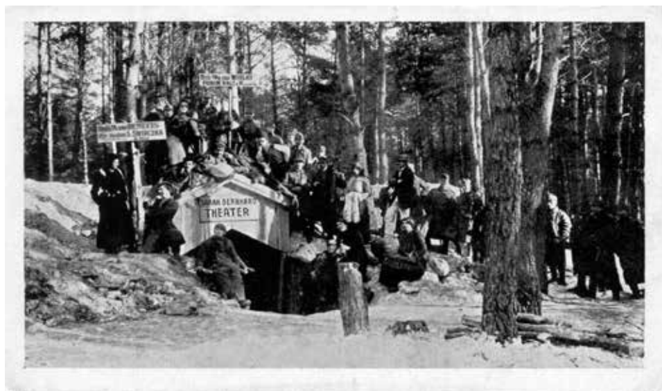
Szczurowice. Teatr polowy 16. pułku obrony krajowej, 1917