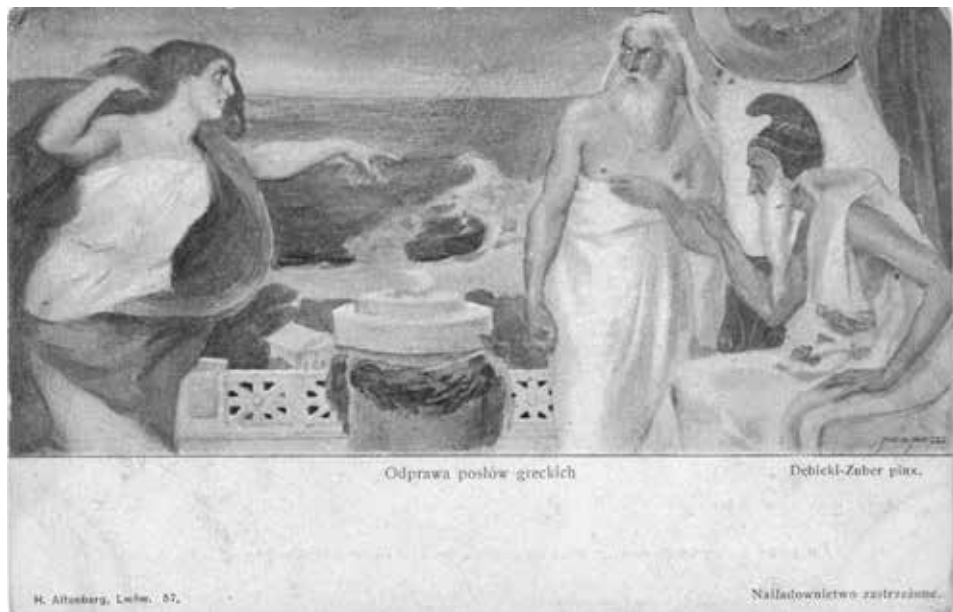
Lwów. Teatr Miejski – malowidło Aleksandra Dębickiego i Juliusza Zuberera Odprawa posłów greckich