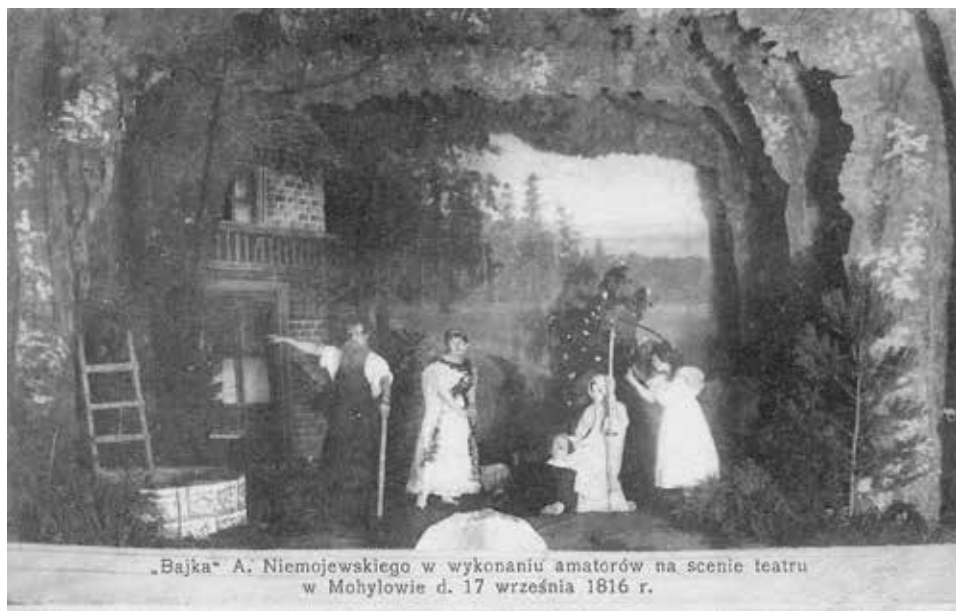
Mohylew. Teatr Miejski – przedstawienie amatorskie, 17 IX 1916