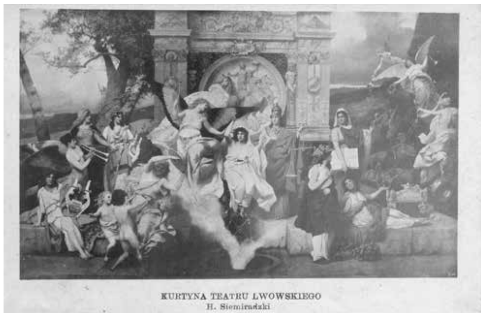
Lwów. Teatr Miejski – kurtyna Henryka Siemiradzkiego