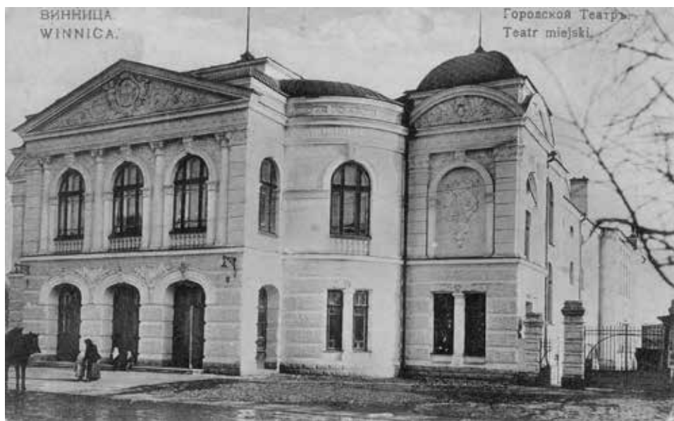
Winnica. Teatr Miejski, ok. 1910