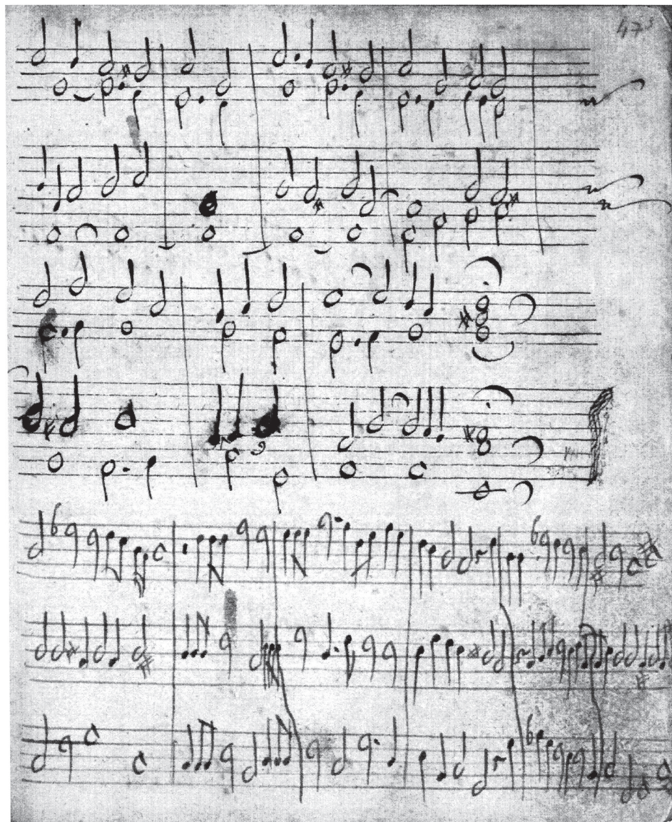
Il. 1b. Ibid., anonimowa pieśń Słuchaj, co żywo (system dolny)