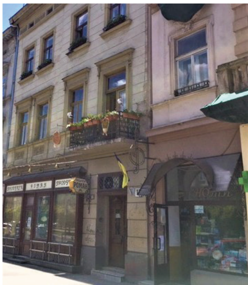
Il. 4. Dom przy ul. Akademickiej 18