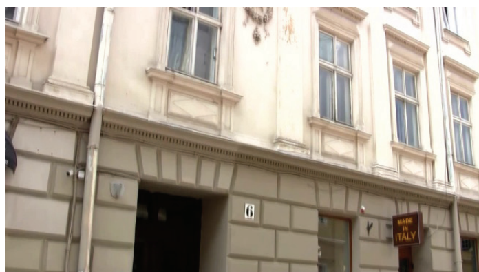
Il. 2. Dom urodzin Zofii Lissy przy ul. Koralnckiej 6 we Lwowie

Odszukany akt urodzenia Lissy uzupełnić możemy drugim nieznanym wcześniej dokumentem notarialnym, czyli aktem ślubu rodziców: