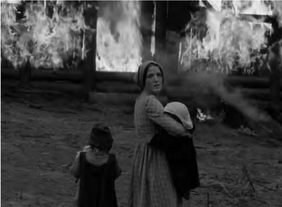
Slovik , reż. Jennifer Kent (2018)