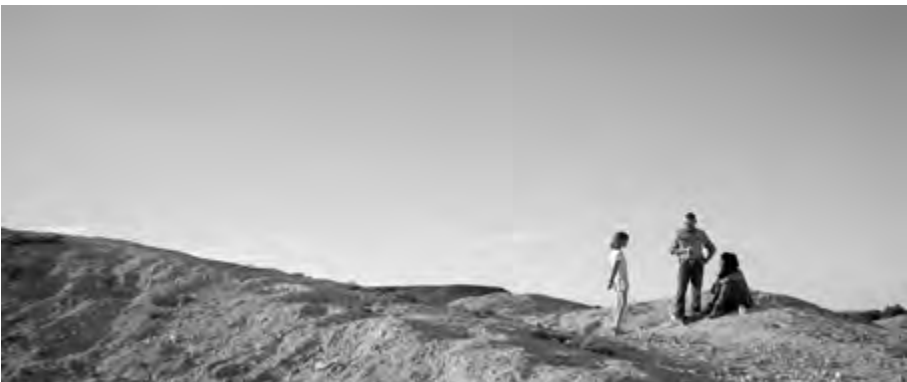
Limbo , reż. Ivan Sen (2023)