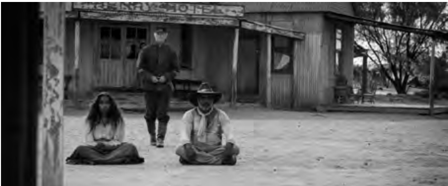
Sweet Country , reż. Warwick Thornton (2017)