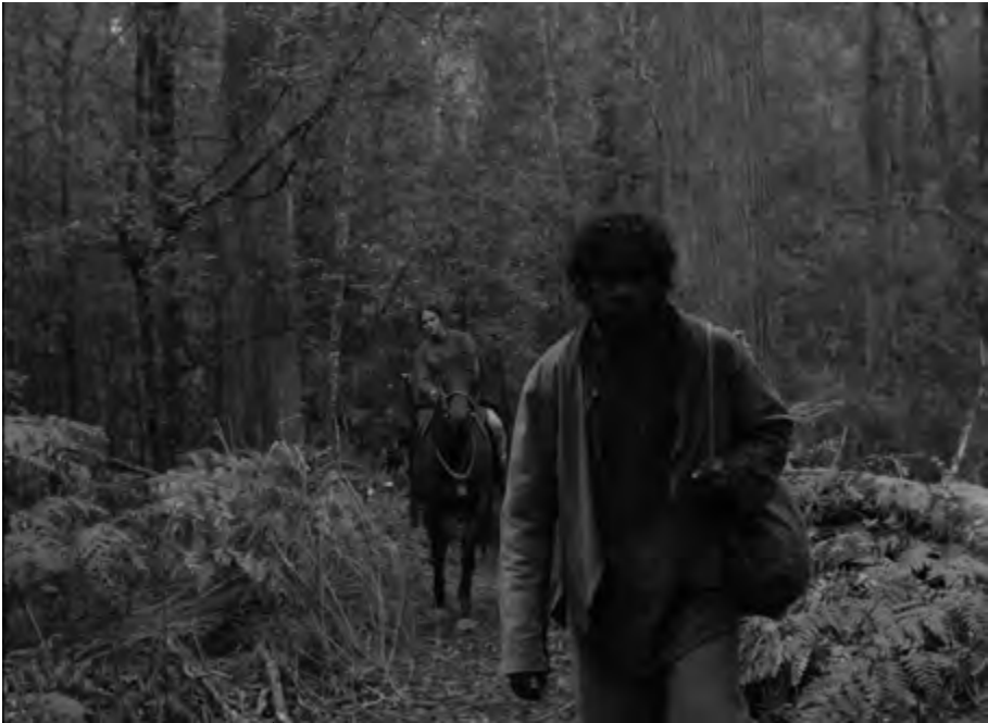
Słowik , reż. Jennifer Kent (2018)