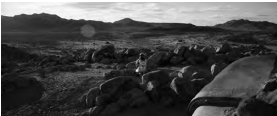
Interstellar , reż. Christopher Nolan (2014)