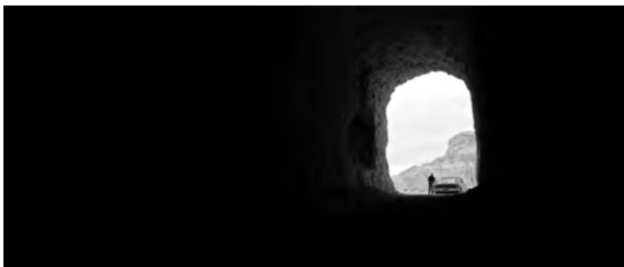
Limbo , reż. Ivan Sen (2023)