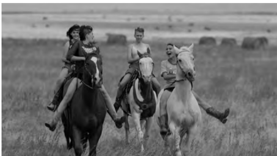
Na wschód od Wall , reż. Kate Beecroft (2025)