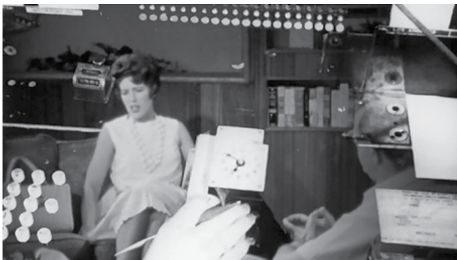
Gloria z waszych wyobrażeń , reż. Jennifer Reeves (2025)