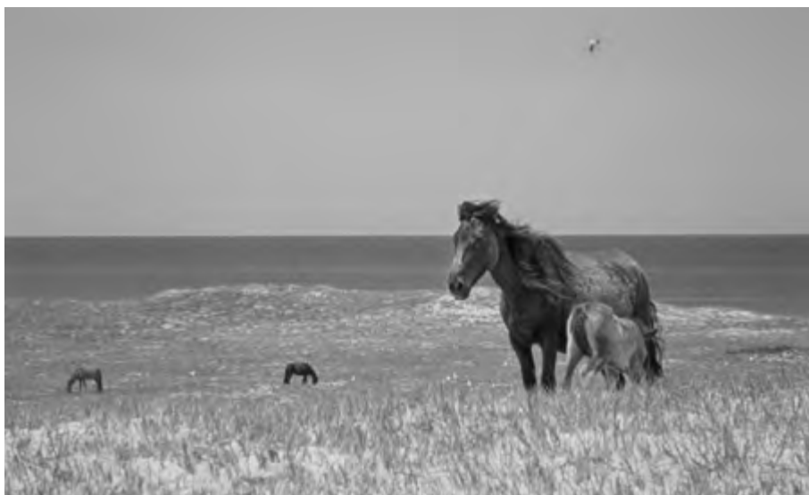
Geografie samotności , reż. Jacquelyn Mills (2022)