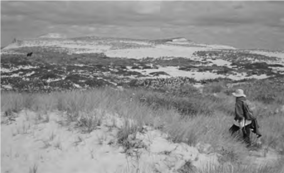
Geografie samotności , reż. Jacquelyn Mills (2022)