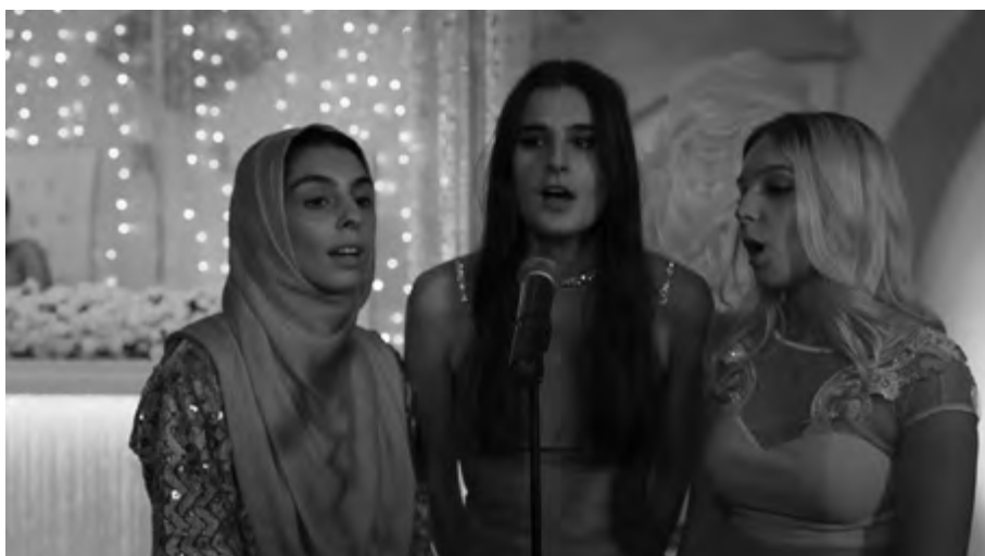
Stońce , reż. Kurwin Ayub (2020)