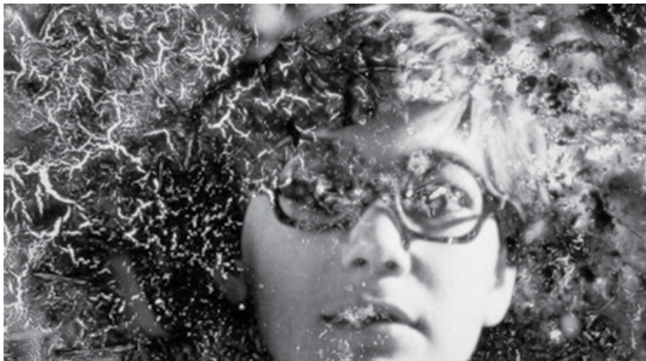
Pigment-Dispersion Syndrome , reż. Jennifer Reeves (2023)