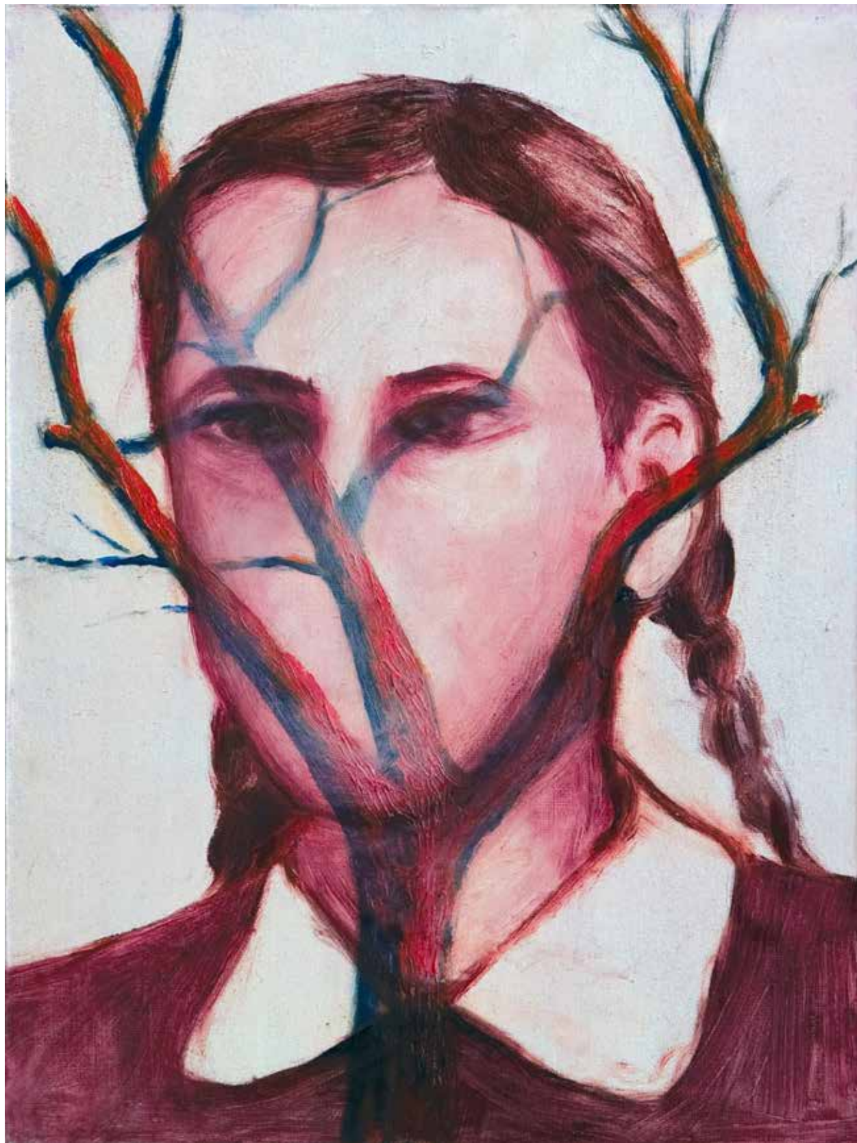
Aleksandra Czerniawska, Portret-drzewo (2) , olej na płótnie, 2010, 40×30 cm.