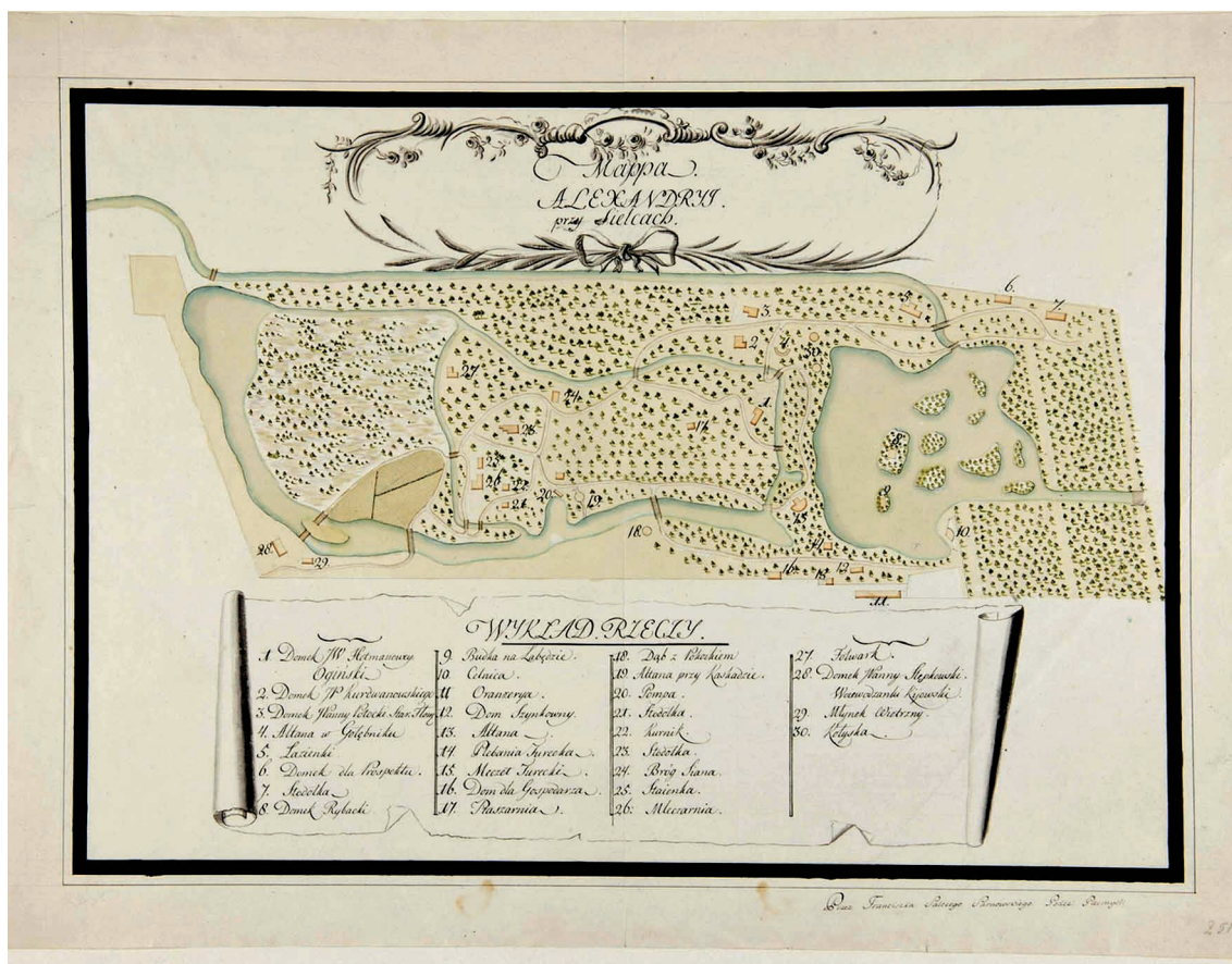
1. Franciszek Salezy Sarnowski, Mappa Alexandryj przy Siedlcach, Gabinet Rycin Biblioteki Uniwersyteckiej w Warszawie, inw. zb. d. 8831.

skiego oraz „Stolarza z Wołynia” 38 . Księżna wyłożyła dodatkowe pieniądze na wykopanie rowu wodnego aż do Ujżanowa (855 zł) oraz połączenie granicznego kanału parkowego z głównym kanałem w ogrodzie włoskim 39 . Prace ogrodnicze nadzorował nieznany z nazwiska „Ogrodnik Siedlecki”, który w pierwszym roku pracy „Fabryki Alexandrowskiej” otrzymał pensję w wysokości 1252 złotych. Jednocześnie przyznano mu dodatkowe pieniądze (333, 10 zł) za „naięcie Ludzi pieszych tysiąca” 40 . Pod jego opieką praktykę ogrodniczą zdobywało czterech ogrodników otrzymujących łączną kwotę roczną 519 zł. Na terenie założenia pracowali również: stolarz Sokołowski, ślusarz Andrys i stolarz Kazimierski 41 .