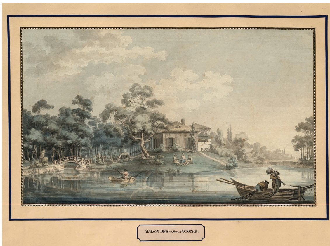
MAISON DE M me S ra POTOCKE.

3. Zygmunt Vogel, Chatka Aleksandry z Lubomirskich Potockiej w Olesinie, z albumu Vues d'Olesin , 1789, Biblioteka Narodowa, sygn. WAF. 20, R. 4399.