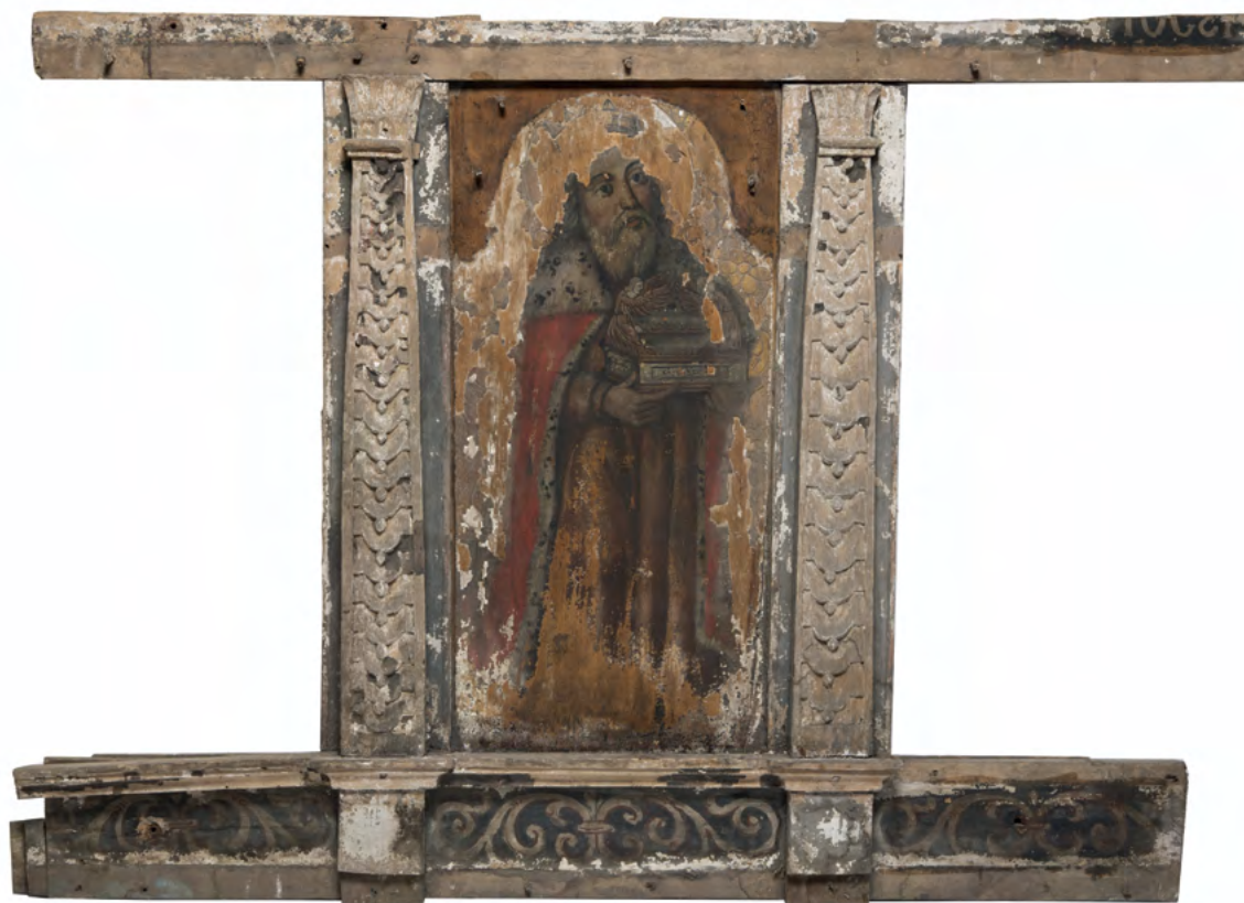
4 Król Dawid, fragment rzędu proroków, Nowoberezowo, cerkiew św. Jana Teologa, ikonostas, 2.–3. ćw. XVII w. (?).

odpowiednimi napisami na fryzie ponad przedstawieniami stanowiącymi część uproszczonego belkowania: „С. ПРО[РО]КЪ ЄРЕМИЈА”, „С. ПРО[РО]КЪ [И]АКОВ.”, „С. ПРО[РО]КЪ АББАК[УМ]” (il. 1) oraz Elizeusza (z otwartą księgą z tekstem odnoszącym się do przejścia proroka suchą nogą przez wodę), Daniela (z kawałkiem skały nie ludzką ręką oderwanej) i Gedeona (z runem oraz z zarysami napisu „С. ПРО[РО]КЪ ГЕД[ЕОН]” na fryzie powyżej) (il. 2). Podobny trójkwaterowy panel z rzędu apostoelskiego przedstawia zapewne św. Pawła (z księgą i z mieczem) oraz dwóch brodatych ewangelistów z księgami (il. 3). Do największych fragmentów należą pojedyncze ikony ujęte pilastrami i dłuższymi odcinkami gzymsów. Jedna z nich przedstawia Króla Dawida (w stroju królewskim, trzymającego w dłoniach Arkę Przymierza) (il. 4), dwie inne apostołów (obaj bez zarostu i bez innych atrybutów niż zwoje pergaminu, czyli zapewne św. Tomasz i św. Filip) (il. 5–6). Również na fryzach nad przedstawieniami uczniów Jezusa znajdowały się pierwotnie objaśniające napisy,