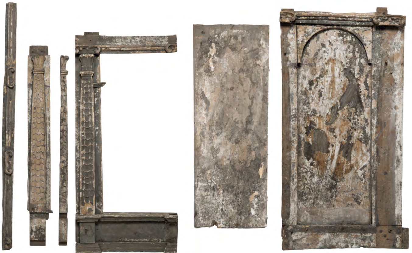
9a–f a.–d. Detale snycerskie; e.–f. deski ikon z rzędu apostołów, Nowoberezowo, cerkiew św. Jana Teologa, ikonostas, 2.–3. ćw. XVII w. (?).

proroka Jeremiasza – niewątpliwie ludzi zamożniejszych, zapewne ze szlachty, uwiecznionych wszak portretowo i to w wyższym rzędzie. Wizerunki tego rodzaju – w pomniejszonej skali, budzącej skojarzenia z tradycją średniowieczną – stosowano w malarstwie ikonowym na ziemiach Rzeczypospolitej przez cały wiek XVII, a nawet w XVIII w., choć w tym stuleciu występowały już raczej w malarstwie o cechach ludowych 6 . Stroje nowoberezowskich fundatorów są malowane sumarycznie, co nie pozwala na ich jednoznaczną