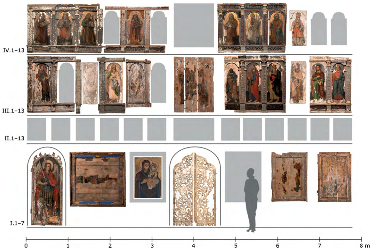
23 Ikonostas w cerkwi św. Jana Teologa w Nowoberezowie, ok. 2.–3. ćw. XVII w. (?), rekonstrukcja stanu ok. 1727 r. w pierwotnej cerkwi