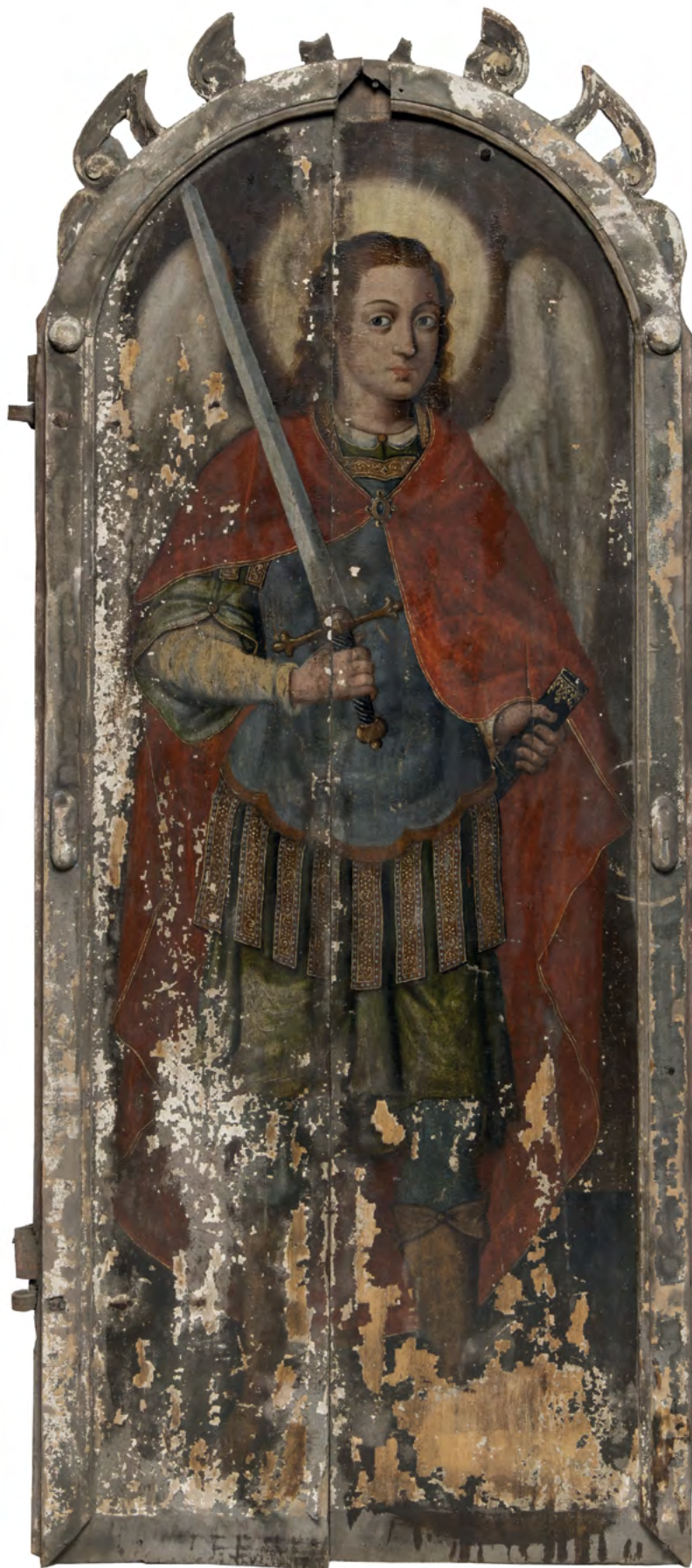
10 Michał Archanioł, drzwi diakońskie, Nowoberezowo, cerkiew św. Jana Teologa, ikonostas, 2.-3. ćw. XVII w. (?). Fot. Piotr Jamski, 2023