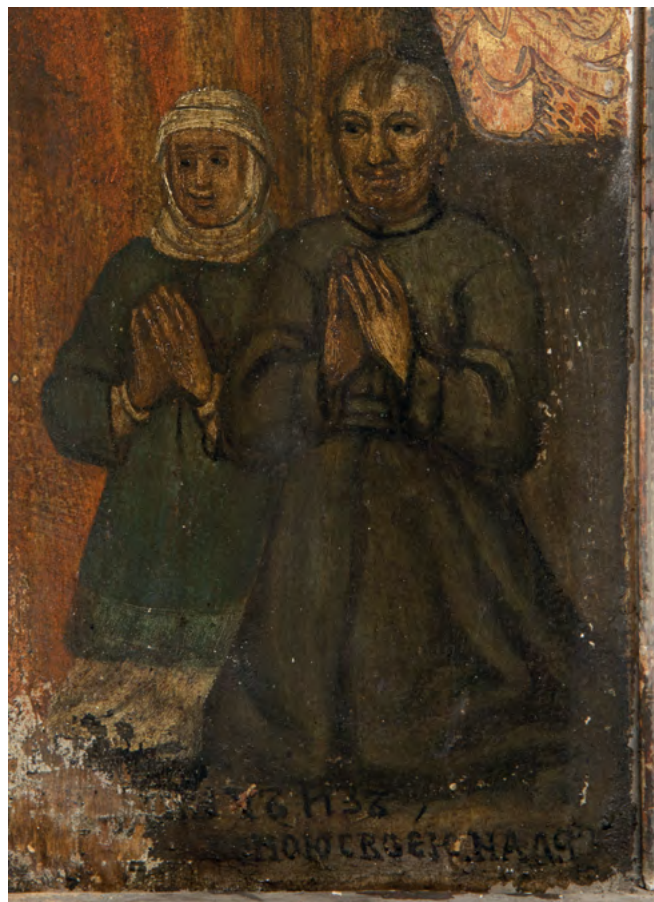
18 Portrety fundatorów na ikonie Prorok Jeremiasz , Nowoberezowo, cerkiew św. Jana Teologa, ikonostas, 2.–3. ćw. XVII w. (?).

przedstawianych często wraz z ojcem, św. Włodzimierzem Wielkim 24 . Za wielkiego księcia kijowskiego należałoby w tej interpretacji uznać postać centralną, w stroju monarszym i z mieczem, natomiast z krzyżem w dłoni przedstawiany jest zarówno Borys, jak i Gleb. W ogólnych zarysach układ ikonostasu w jego stanie w 1784 r. można zatem rekonstruować następująco: po lewej stronie carskich wrót umieszczona była – zgodnie z kanonem – ikona Matki Boskiej z Dzieciątkiem (zachowana w nawie, przemalowana), obok św. św. Włodzimierza, Borysa i Gleba (destrukt), na