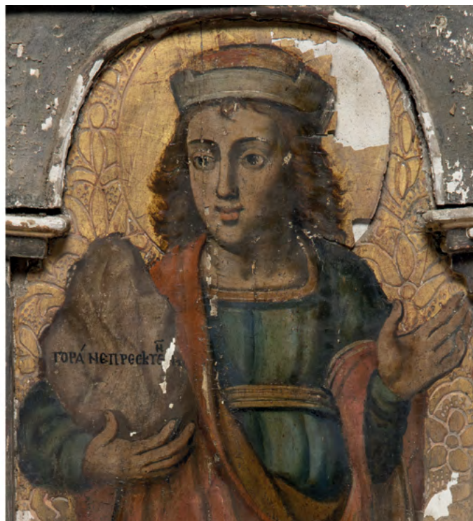
22a–b a. Król Dawid; b. Daniel, twarze postaci z rządu proroków, Nowoberezowo, cerkiew św. Jana Teologa, ikonostas, 2.–3. ćw. XVII w. (?).

wreszcie domniemaniem usytuowania portretów i napisów fundatorskich w sąsiedztwie osi środkowej.