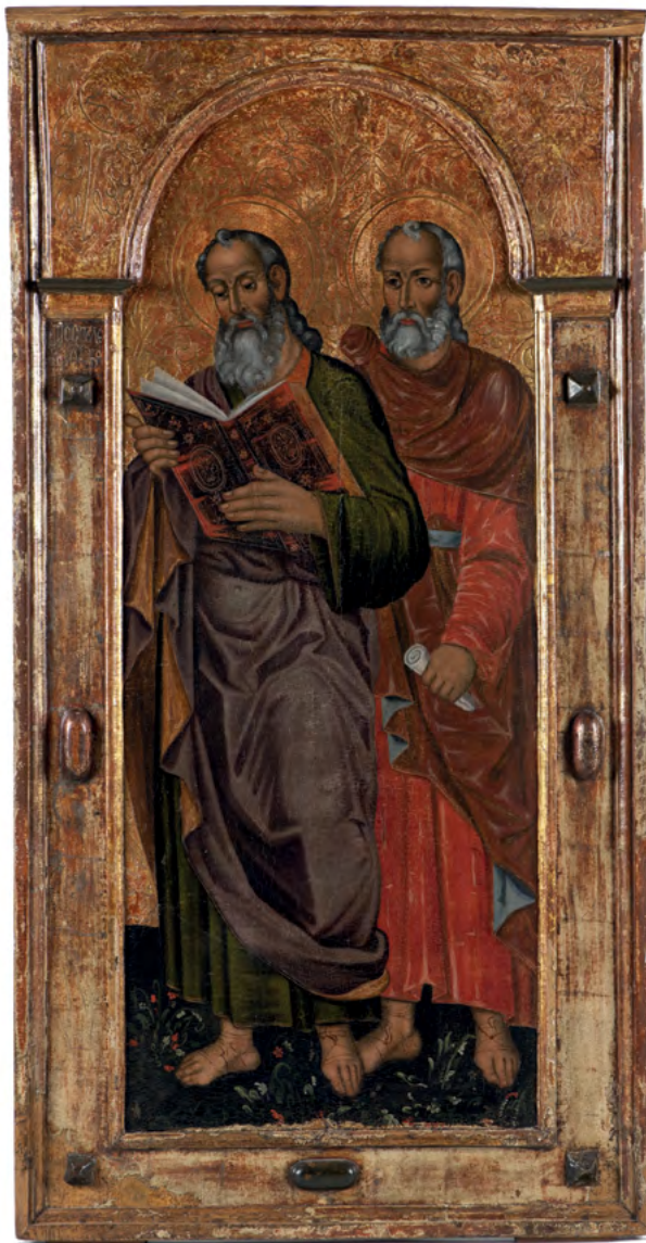
29 Ikona z ikonostasu cerkwi w Czyżach, XVII w.: św. św. Jan Ewangelista i Szymon Apostoł, Muzeum Ikon w Supraślu.