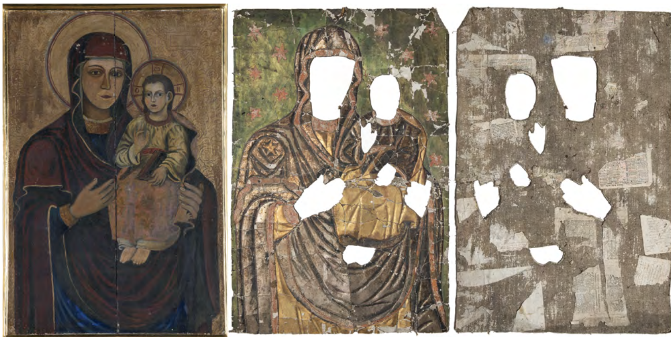
15 a–c a. Matka Boska z Dzieciątkiem, 2.–3. ćw. XVII w. (?), przemalowana przed 1963; b. okład, po 1761; c. okład (rewers), Nowoberezowo, cerkiew św. Jana Teologa, pierwotnie w ikonostasie, 2.–3. ćw. XVII w. (?).

Zwraca uwagę kontrast między stosunkowo dokładnie scharakteryzowanymi drzwiami królewskimi (być może nowymi) a „staroświeckimi” rzędami powyżej. Dostawiono rzeźby św. św. Piotra i Pawła, elementy obce tradycji Kościołów wschodnich, co stanowiło przejaw postępującej w XVIII w. latynizacji wystrojów cerkwi unickich. Zaskakuje informacja, że w rzędzie namiestnym znajdowały się wówczas jedynie ikony Matki Boskiej z Dzieciątkiem i Chrystusa Pantokratora, co może świadczyć o niedokładności opisu, choć zarazem czytamy też o umieszczeniu w ołtarzu bocznym wyobrażenia św. Jana Teologa. Sugeruje to przeniesienie ikony świątynnej (chramowej), związanej z wezwaniem cerkwi, z ikonostasu do innej nastawy. Notabene, w drugim ołtarzu bocznym znajdowała się malowana na desce ikona św. Onufrego 21 , której pozostałość (destrukta o ledwie widocznych zarysach postaci) również udało się odnaleźć na strychu. Jeśli nawet część przedstawień wyjęto z rzędu namiestnego,