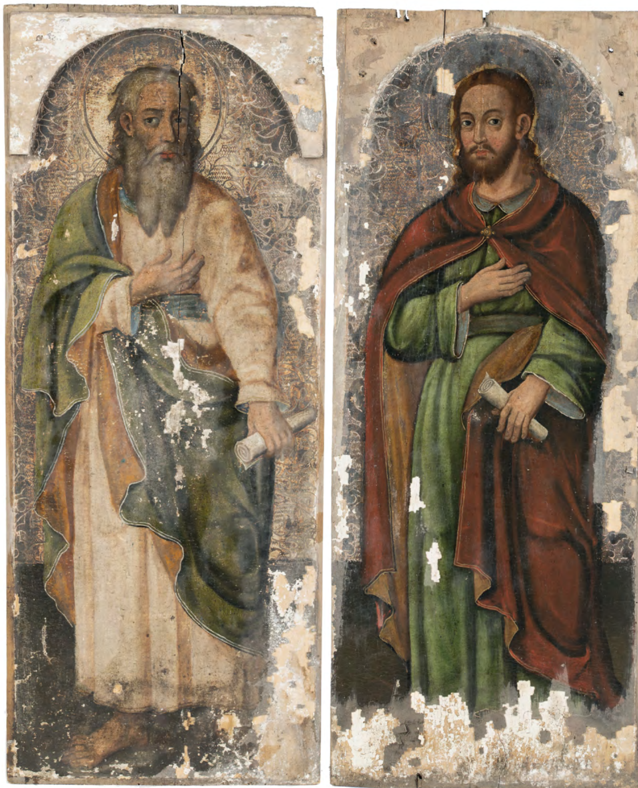
8a-b Apostołowie, fragment rzędu apostołów, Nowoberezowo, cerkiew św. Jana Teologa, ikonostas, 2.-3. ćw. XVII w. (?). Fot. Piotr Jamski, 2023