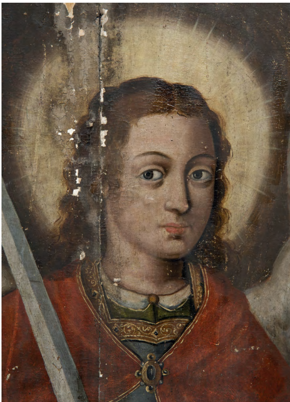
11 Michał Archanioł, fragment, drzwi diakońskie, Nowoberezowo, cerkiew św. Jana Teologa, ikonostas, 2.-3. ćw. XVII w. (?). Fot. Piotr Jamski, 2023

sposób ukazać powierzchnię namalowanych przedmiotów – chłód stali miecza i jego rękojeści czy fakturę haftu, a także miękkiego futra gronostaja (il. 16).