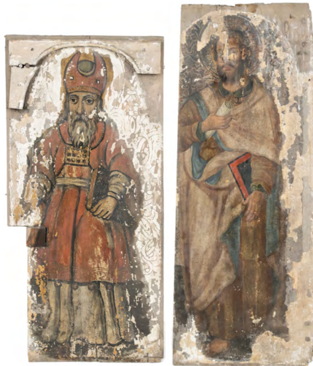
7a–b a. Aaron, fragment rzędu proroków; b. apostoł, fragment rzędu apostołów, Nowoberezowo cerkiew św. Jana Teologa, ikonostas, 2.–3. ćw. XVII w. (?).