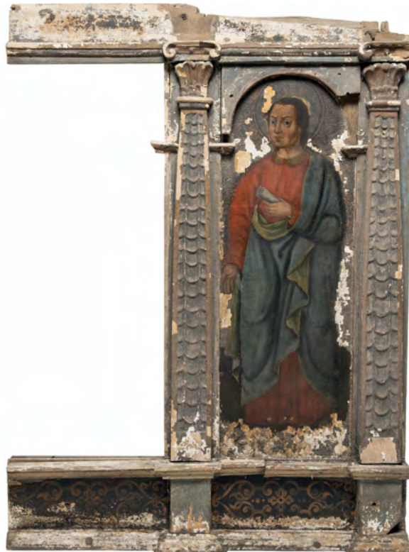
6 Św. Filip (?), fragment rzędu apostołów, Nowoberezowo, cerkiew św. Jana Teologa, ikonostas, 2.-3. ćw. XVII w. (?).

szaty Jezusa, lecz również dostrzegamy tu jeden z elementów mogących dać asumpt do datowania: ornament okuciowy dekorujący tron Zbawiciela. W jeszcze bardziej dramatycznym stanie są ikony z rzędu namiestnego: Św. Jan Ewangelista (Teolog), którego rozpoznajemy po widocznym fragmencie twarzy (oko, siwe wąsy starca, zarys nimbu) i otwartej księdze (il. 13), oraz mające niemal identyczne wymiary Zwiastowanie. Z tej sceny na desce pozostały tylko fragmenty postaci Archanioła Gabriela (ręce i lilia w dłoni), część sylwetki Marii, a także zarysy architektury i baldachimu w tle (il. 14). Obie te ikony mają również resztki takiego samego obramienia z analogicznym układem rautów i filigranowym ornamentem malowanym białą farbą na błękitnym tle. Jak wspomniano, do tej samej grupy zaliczamy całkowicie przemalowaną ikonę Hodegetrii o wymiarach zbliżonych do dwóch poprzednich wizerunków (il. 15a). Ostatnią wreszcie spośród ikon, niemal doszczętnie zniszczoną, charakteryzuje format zbliżony do kwadratu i zaskakująco duże wymiary – większe niż ikon namiestnych. Warstwa malarska odspoiła się wraz z gruntem na niemal