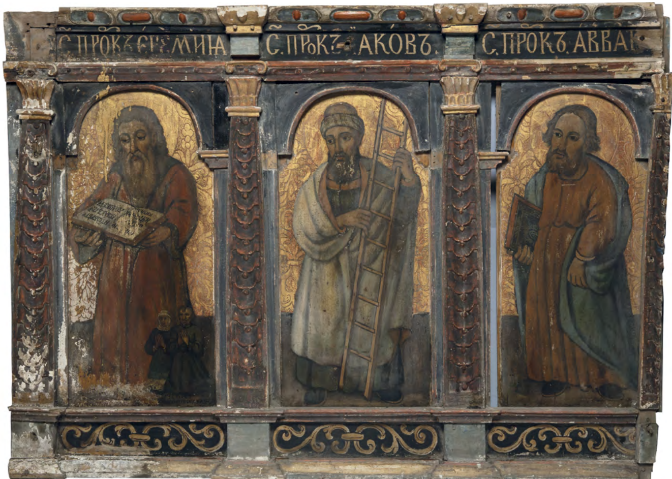
1 Prorocy Jeremiasz, Jakub, Habakuk, fragment rzędu proroków, Nowoberezowo, cerkiew św. Jana Teologa, ikonostas, 2.–3. ćw. XVII w. (?). Fot. Piotr Jamski, 2023

Wśród różnych artefaktów, jak uszkodzone ferefony czy szaty liturgiczne, na strychu cerkwi filialnej w Nowoberezowie odnaleźliśmy 17 jednolitych stylistycznie większych fragmentów ikonostasu z malowanymi temperą na deskach ikonami, cztery niewielkie elementy ornamentalne tejże struktury (części pilastrów) oraz spróchniałe drzwi królewskie (święte drzwi, carskie wrota), które prawdopodobnie również stanowiły jej część, choć zapewne były w niej zamontowane wtórnie, na co wskazuje wyższy poziom wykonania i odmienna stylistyka niż pozostałych elementów snycerskich. Wśród odnalezionych relikwów trzeba wymienić także okład ikony Hodegetrii