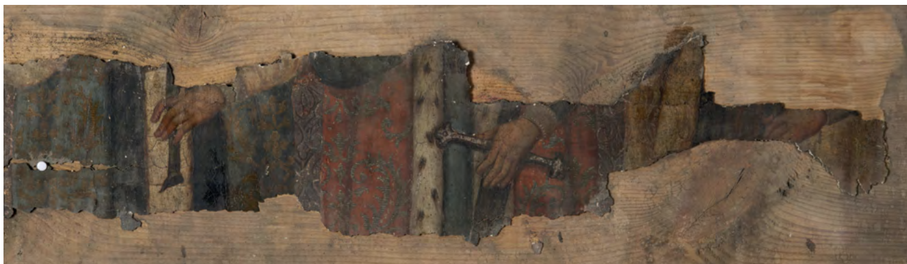
16 Św. św. Włodzimierz, Borys i Gleb, XVII/XVIII w. (?), Nowoberezowo, cerkiew św. Jana Teologa, niegdyś w ikonostasie z 2.–3. ćw. XVII w. (?). Fot. Piotr Jamski, 2023

Kitayczanych N[umer]o 2. Obok tego Obrazu Obraz Romana i Dawida, na którym Koronka srebrna 1, obok którego Drzwi na zawiasach żelaznych, na których obraz So Michała Archanioła. Ponad ktorem na Tablaturze malowanych Struktury Stolarskiej dwunastu Prażników, na ścianie w gorze 12 Apostołów z Archierejem i proroków na Tablaturze malowanych staroświeckich. Drzwi Carskie stolarskiej roboty Farbami, Złotem i Srebrem malarskim przystoynie ozdobione, przy których osob snycerskiej roboty na Postumentach stojących malarsko ozdobionych n[umer]o 2, przy tychże Drzwiach Carskich kraty Tokarskiej roboty 22 .