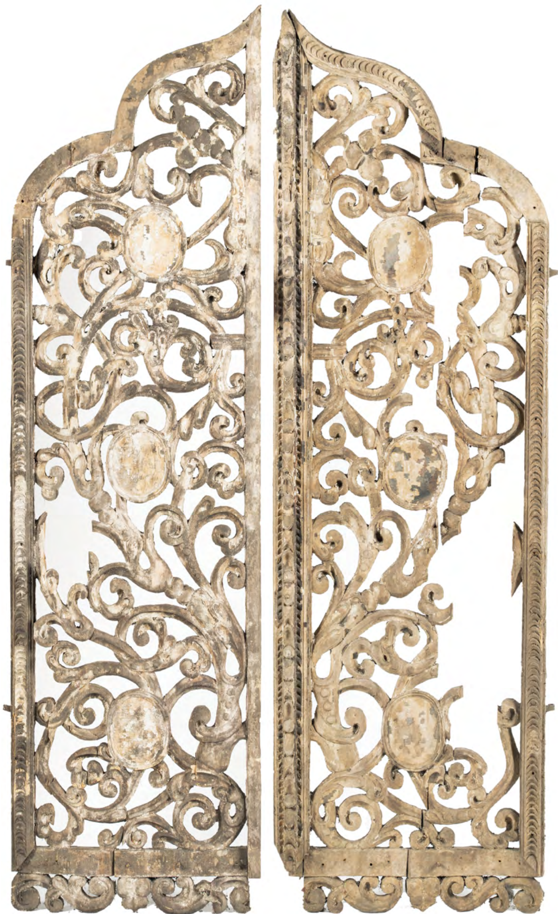
19 Drzwi królewskie, 3.-4. ćw. XVII w. (?), Nowoberezowo, cerkiew św. Jana Teologa, zapewne niegdyś w ikonostacie z 2.-3. ćw. XVII w. (?). Fot. Piotr Jamski, 2023