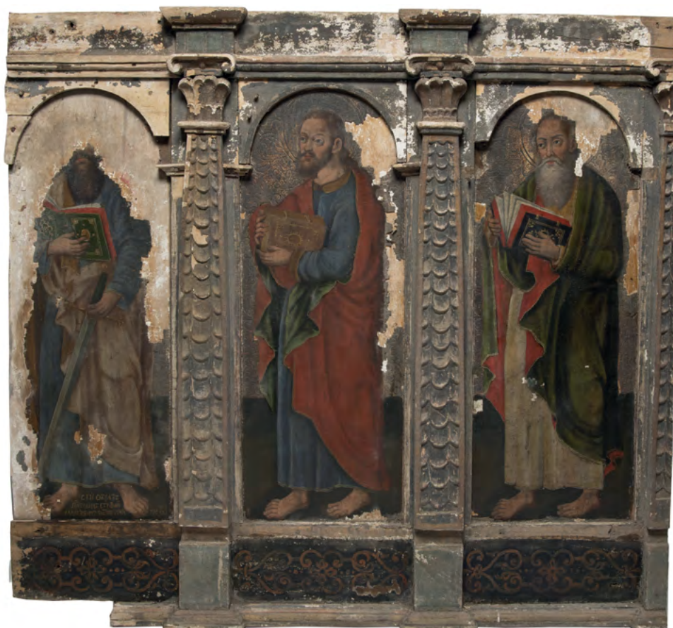
3 Św. Paweł i ewangeliści (?), fragment rzędu apostołów, Nowoberezowo, cerkiew św. Jana Teologa, ikonostas, 2.-3. ćw. XVII w. (?). Fot. Piotr Jamski, 2023