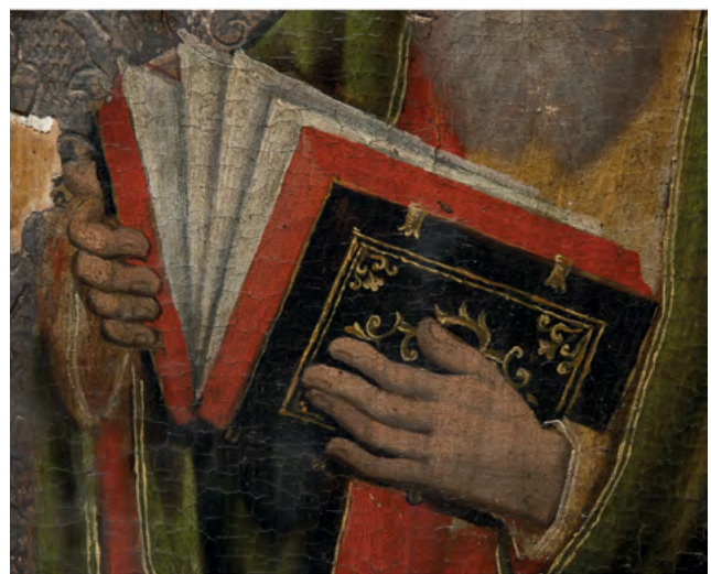
20 Księgi w dłoniach ewangelistów (?) w rzędzie apostołów, Nowoberezowo, cerkiew św. Jana Teologa, ikonostas, 2.–3. ćw. XVII w. (?). Fot. Piotr Jamski, 2023

ewangelistów trzymających księgi, po nich apostołów ze zwojami, w osiach skrajnych św. Tomasza i św. Filipa (obu bez zarostu), obserwacją trwałego zmontowania trójprzęsłowych segmentów, zapewne wygodnego w transporcie (widocznego od tyłu w ich stolarskiej konstrukcji) oraz czytelnych w strukturze punktów pierwotnego styku niektórych elementów i staranniejszego wykończenia krawędzi skrajnych segmentów,