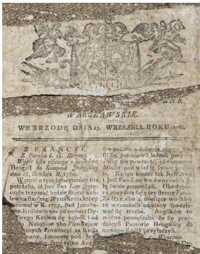
27 Fragment gazety „Wiadomości Uprzywilejowane Warszawskie”, 23 września 1761, wyklejka rewersu okładu ikony Matki Boskiej, Nowoberezowo, cerkiew św. Jana Teologa. Fot. Piotr Jamski, 2023

Chrystusa Pantokratora musiała już w tym czasie prezentować się oczom współczesnych niekorzystnie, skoro w 1836 r. zanotowano, że brakuje na niej złoceń podobnych do tych na ikonie Matki Boskiej 34 . Zapewne zamierzano ten stan zmienić poprzez sprawienie okładu. Nie jest pewne, jak długo stara przegroda przetrwała, lecz najpóźniej do roku 1883, kiedy przeprowadzono wspomniany remont świątyni i ustawiono nową strukturę z kompletem ikon sygnowanych w tymże roku przez wileńskiego malarza Jegora A. Mołokina. Być może przywiązanie lokalnej społeczności do tradycji i pamięci o przeszłości parafii sprawiło, że nie