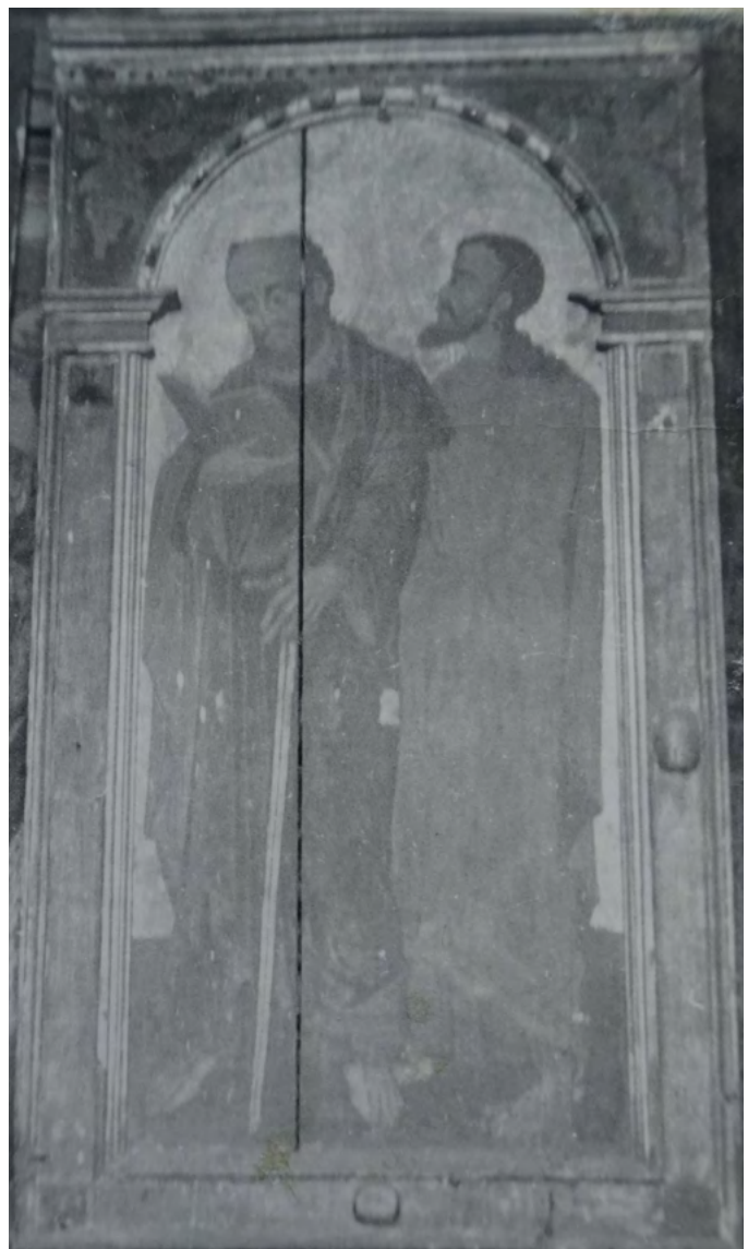
30 Ikona z ikonostasu cerkwi w Czyżach, XVII w.: św. Paweł i nieustalony apostoł, zaginiona. Fot. NID, 1963

takich elementów, jak gwoździe oraz rauty (lub ślady po nich) rozpoznajemy św. Jana Ewangelistę i Zwiastowanie. Niestety w tym drugim przypadku ubytki gruntu i warstwy malarskiej są obecnie większe niż u schyłku XX w.