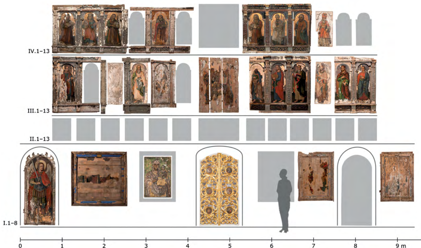
24 Ikonostas w cerkwi św. Jana Teologa w Nowoberezhowie, ok. 2.–3. XVII w. (?), rekonstrukcja stanu po przeniesieniu do nowej cerkwi w 1771 r.