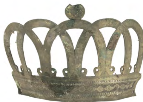
28 Korony, XVII/XVIII w., XVIII/XIX w., Nowoberezowo, cerkiew św. Jana Teologa.

tylko w nowej konstrukcji wykorzystano elementy z XVIII w. (co nie było rzadkością), lecz również nie zniszczono pozostałych relikwów, które być może już wówczas złożono na strychu, gdzie przez dekady nie budziły zainteresowania. Na zdjęciu tej przestrzeni z 1988 r. widać stare drzwi królewskie ułożone na belkach więźby w sposób identyczny jak w czasach obecnych 35 . Z kolei na fotografii z lipca 1995 r., dołączonej do dokumentacji konserwatorskiej remontu cerkwi, pozostałości struktury widoczne są w tym samym miejscu strychu, w którym zostały odnalezione przez nas w 2023 r. 36 Po kształcie desek i układzie