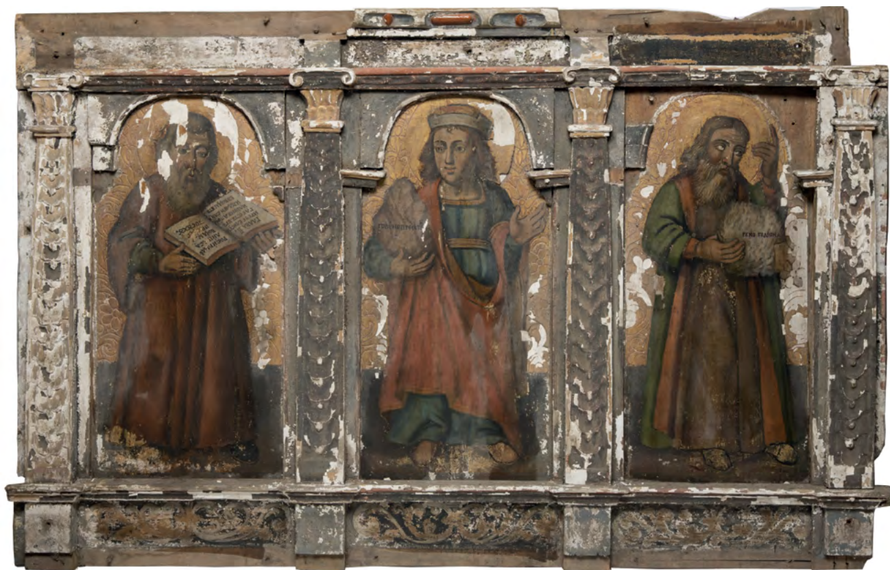
2 Prorocy Elizeusz, Daniel, Gedeon, fragment rzędu proroków, Nowoberezowo, cerkiew św. Jana Teologa, ikonostas, 2.-3. ćw. XVII w. (?).