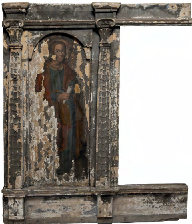
5 Św. Tomasz (?), fragment rzędu apostołów, Nowoberezowo, cerkiew św. Jana Teologa, ikonostas, 2.-3. ćw. XVII w. (?). Fot. Piotr Jamski, 2023