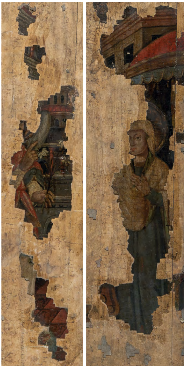
14 Zwiastowanie, fragmenty, Nowoberezowo, cerkiew św. Jana Teologa, ikonostas, 2.-3. ćw. XVII w. (?). Fot. Piotr Jamski, 2023

wyjątkowe 19 . W akcie wizytacji przeprowadzonej w 1759 r. przez ks. Aleksandra Jodkę wymieniono „[...] Carskie Wrota snickerskiej roboty piękne złotem, srebrem y roznemi farbami adornowane ze dwoma statuami SS. Apostołów Piotra y Pawła dużemi rznieżtemi, ponad ktoremi deisus cały staroswieckiey roboty z Apostołami, Praznikami, Archiierieim y Prorokami idzie. Po bokach zaś tych Carskich Drzwi znajduie się dwa obrazów namiestnych Salvatoris et B[eat]ae V[irginis] Mariae” 20 . Ten nieco chaotyczny i chyba po- bieżny opis sugeruje, że pomiędzy rokiem 1727 a 1759 zaszły pewne zmiany w wyglądzie rzędu namiestnego.