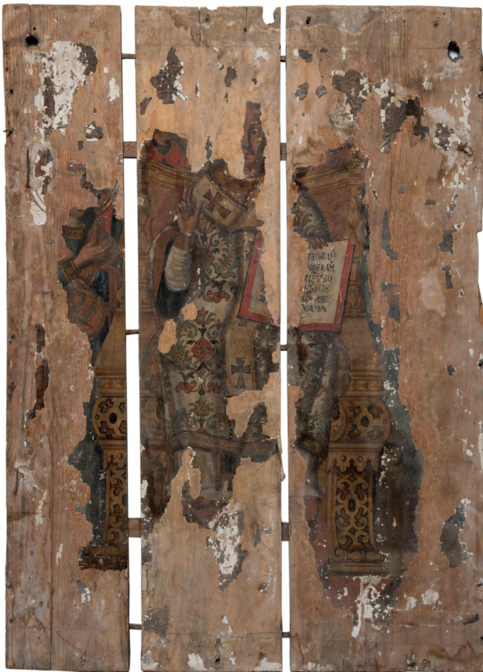
12 Deesis, Nowoberezowo, cerkiew św. Jana Teologa, ikonostas, 2.-3. ćw. XVII w. (?). Fot. Piotr Jamski, 2023

w polskich zbiorach, np. ornat z włoskiego brokatu fundacji króla Stefana Batorego z ok. 1580 r. (katedra na Wawelu), komplet szat liturgicznych fundowanych ok. 1600 r. przez biskupa poznańskiego i prymasa Jana