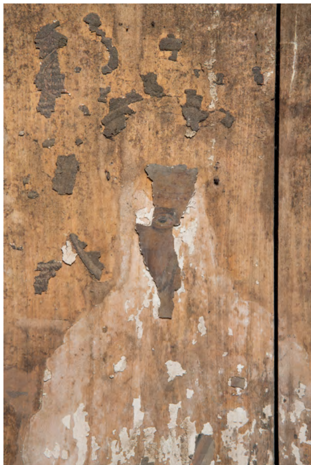
13 Św. Jan Ewangelista (Teolog), fragment, Nowoberezowo, cerkiew św. Jana Teologa, ikonostas, 2.–3. ćw. XVII w. (?).

ikon w strukturze przegrody (il. 23–24), a nawet do pewnego stopnia umożliwi prześledzenie jej przemian w ciągu kilku stuleci (choć zarazem należy podkreślić, że nie wszystkie przywoływane tu dokumenty są precyzyjne i wyczerpujące 17 ). Najstarszy zachowany akt wizyty świątyni pochodzi z 1727 r. Czytamy w nim: „Deisus z Prorokami, Apo[osto]łami y Praznicznemi pod pozłotę między kolumny tysiąc złotych waloru lub więcej. Obrazow namiestnych pięć de[...]nych (?) z ołtarzykami porządnie przybranemi. Carskie Drzwi snickersko rżnięte pod pozłotę oprawne. Sywierne Drzwi iedne z malowaniem na zawiasach” 18 . Opis ten – choć lakoniczny – podaje kilka ważnych informacji. Po pierwsze, wiadomo, że ikonostas był czterorzędowy – z rzędami namiestnym, świętecznym, apostołskim i proroków. Po drugie, wskazano architektoniczną artykulację rzędów. Po trzecie, wizytator wysoko ocenił jakość złocień, co świadczyć może o tym, że opisywał strukturę w swojej opinii efektowną. Po czwarte, jednoznacznie wymieniono tylko jedne drzwi diakońskie (pod często wówczas stosowaną nazwą „sywiernych”), a zarazem odnotowano pięć ikon namiestnych, zatem przypuszczalnie zastosowany został układ siedmioosiowy, w którym po stronie lewej znajdowały się dwie ikony i drzwi diakońskie, a od prawej trzy ikony. Prawdopodobnie w XVII i na początku XVIII w. nie było to rozwiązanie