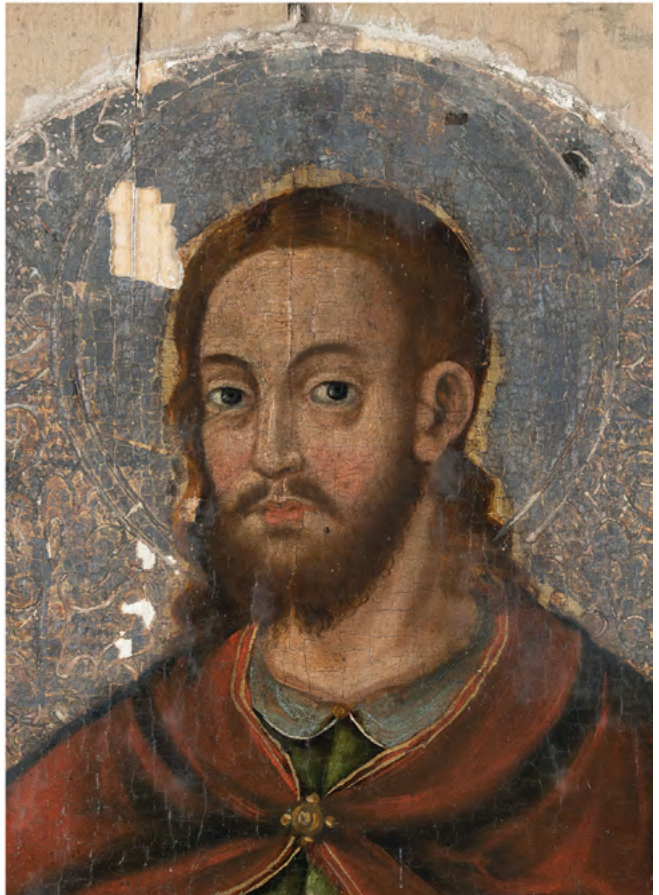
21 Twarze apostołów, Nowoberezowo, cerkiew św. Jana Teologa, ikonostas, 2.-3. ćw. XVII w. (?). Fot. Piotr Jamski, 2023