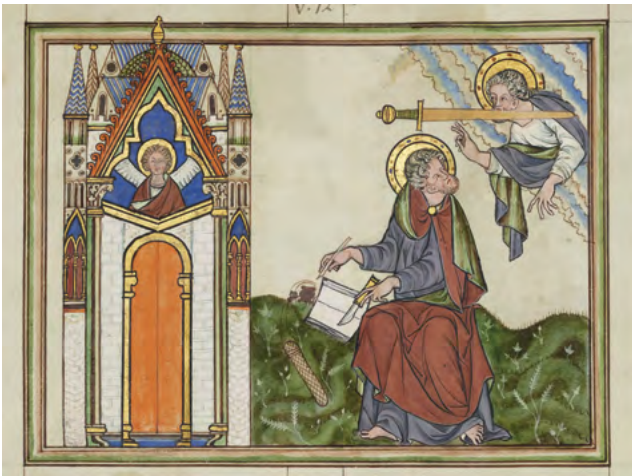
12 Kościół Pergamonu, miniatura w The Douce Apocalypse , ok. 1265–1270, Oxford, Bodleian Libraries, MS. Douce 180, fol. 15v.