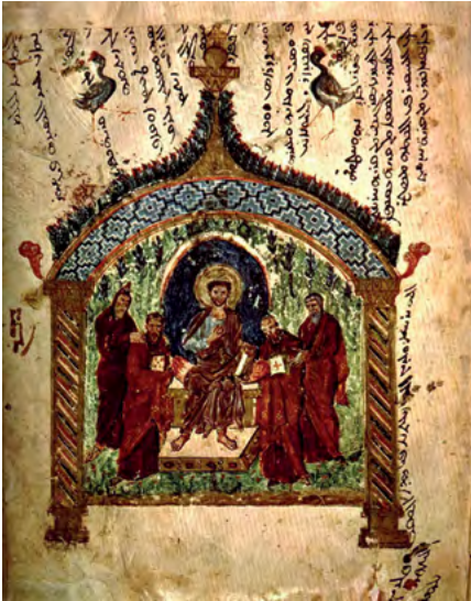
5 Chrystus na tronie , miniatura z Ewangeliarza Rabuli, VI w., Florencja, Biblioteca Mediceo Laurenziana, cod. Plut. I, 560, fol. 14r.