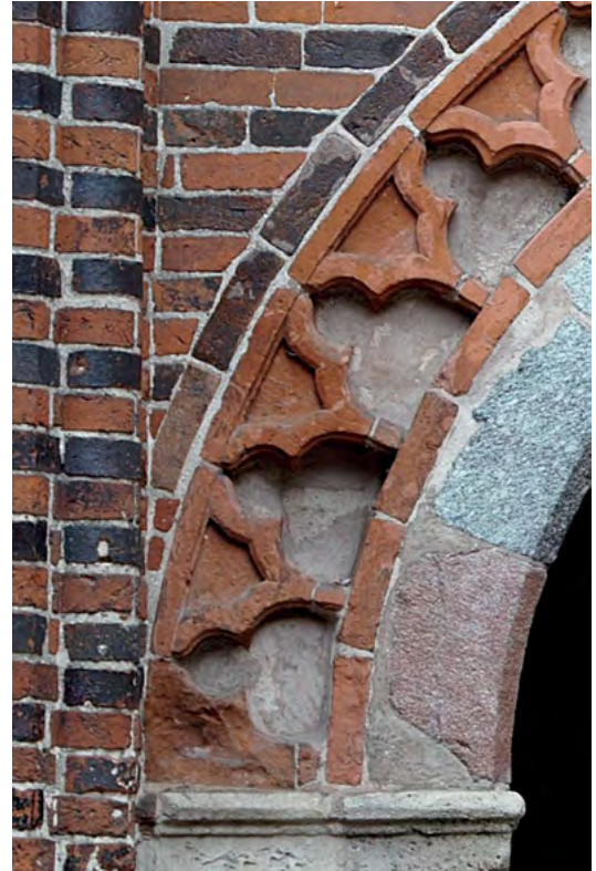
3 Malbork, Zamek Wysoki, brama w elewacji północnej.