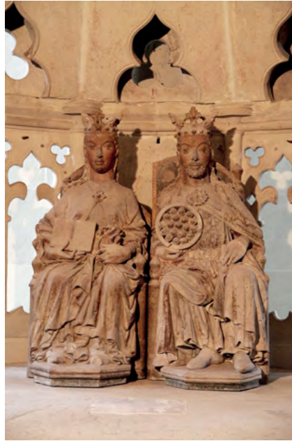
8 Magdeburg, katedra, kaplica szesnastoboczna. Fot. Jarosław Jarzewicz 9 Magdeburg, katedra, kaplica szesnastoboczna, fragment wnętrza. Fot. Jarosław Jarzewicz

zostały wycięte przezrocza o fantazyjnych kształtach, z dominującymi łukami w ośli grzbiet, które potęgują jej niezwykle, egzotyczny wygląd.