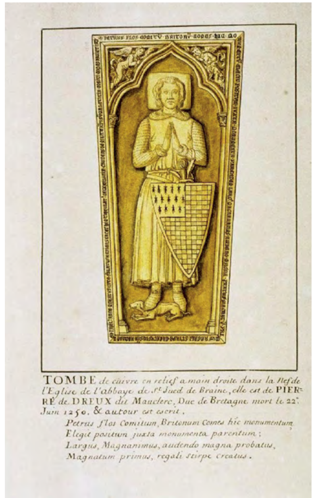
11 Nagrobek Pierre'a de Dreux zwanego Mauclerc, pierwotnie w Saint-Yved w Braine, rycina z kolekcji Gaignières.

Forma łuku w osli grzbiet została rozpowszechniona, a wręcz stała się podstawą architektonicznego słownika w angielskim stylu dekoracyjnym (Decorated Style) u schyłku XIII i w 1. połowie XIV w. Najwcześniejsze przykłady jej zastosowania w monumentalnej skali są związane z artystycznymi fundacjami dworu Edwarda I – króla-krzyżowca (w latach 1269–1272 przebywał w Outremer). Należą do nich tzw. Eleanor Crosses (il. 14) – pomniki upamiętniające pogrzeb zmarłej w 1290 r. królowej Eleonory Kastyljskiej 22 , która razem z Edwardem uczestniczyła w wyprawie krzyżowej. Również w tym wypadku jest bardzo prawdopodobne, że „wschodnie” formalne konotacje miały istotne znaczenie treściowe.