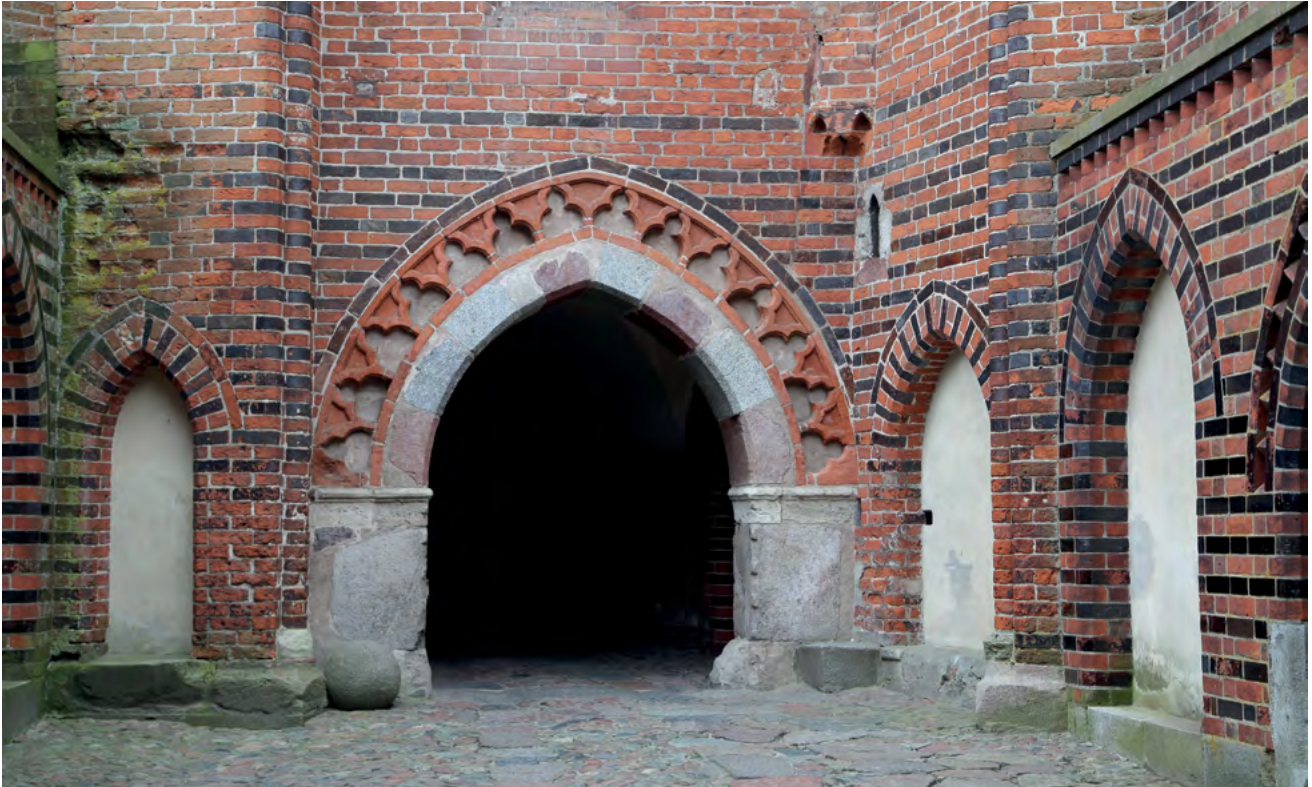
2 Malbork, Zamek Wysoki, fragment wnęki z bramą w elewacji północnej.

oryginalne potwierdzają, że rekonstrukcje wiernie odwzorowują pierwotny kształt. Pojawienie się łuku w osi grzbiet w najwcześniejszej części Zamku Wysokiego ma znaczenie „formy krytycznej”, czyli, w tym przypadku, ujawniającej istotne przesłanie 3 . Wyeksponowanie takich łuków na bramie zamkowej, w miejscu bezsprzecznie widocznym, stąd z reguły