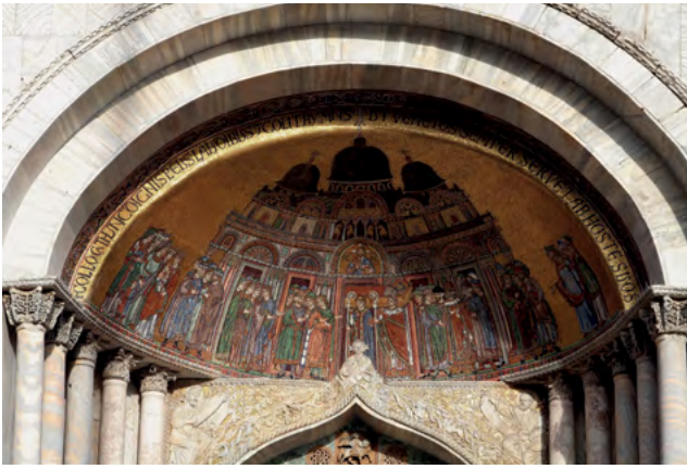
15 Wenecja, bazylika św. Marka, portal północny fasady zachodniej (Porta San Alipio).