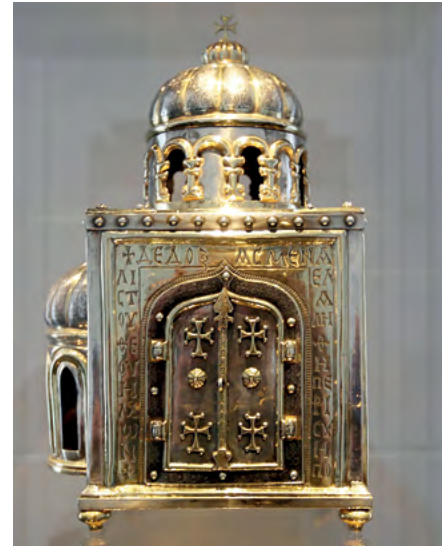
7 Relikwiarz św. Anastazego, Akwizgran, skarbiec katedralny.

Poza nielicznymi wyjątkami z przełomu XIII i XIV w. rozpowszechnił się dopiero w 2. połowie XIV w. 6 Łuki w ośli grzbiet były wykorzystywane zwłaszcza na terenie państwa krzyżackiego ok. 1300 r., choćby w maswerkach chóru kościoła świętych Janów w Toruniu i kaplicy zamkowej w Lochstedt, gdzie zapewne pojawiły się pod wpływem malborskiego wzorca 7 .