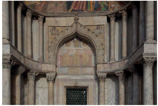
16 Wenecja, bazylika św. Marka, portal południowy fasady zachodniej.

z łukami w ośli grzbiet znajdują się też w elewacji północnej (Porta dei Fiori, 1250–1260 r.), a także we wnętrzu w skrzydłach transeptu (Porta San Giovanni, ok. 1280 r.) 25 . Znaczenie tych orientalnych form wydaje się w Wenecji oczywiste – to właśnie Wschód był źródłem bogactwa i politycznej potęgi republiki. Relikwie jej patrona – św. Marka – zostały według tradycji wykradzione i przewiezione przez Wenecjan z Aleksandrii. Oczywiste wydaje się również i to, że te weneckie przedsięwzięcia artystyczno-propagandowe były znane krzyżakom, a przynajmniej ich najważniejszym dostojnikom. Przypomnijmy, że po upadku Akki to to właśnie w Wenecji niemal przez dwadzieścia lat (1291–1309 r.) mieściła się oficjalna siedziba zakonu.