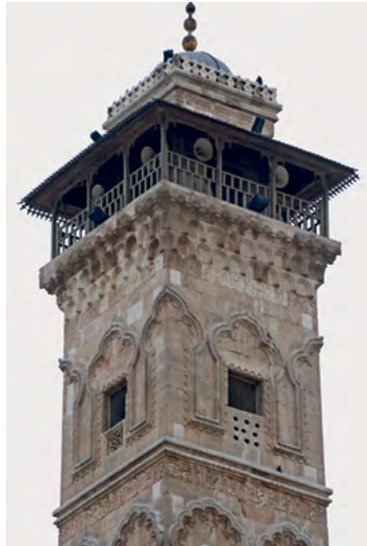
6 Aleppo, minaret Wielkiego Meczetu.