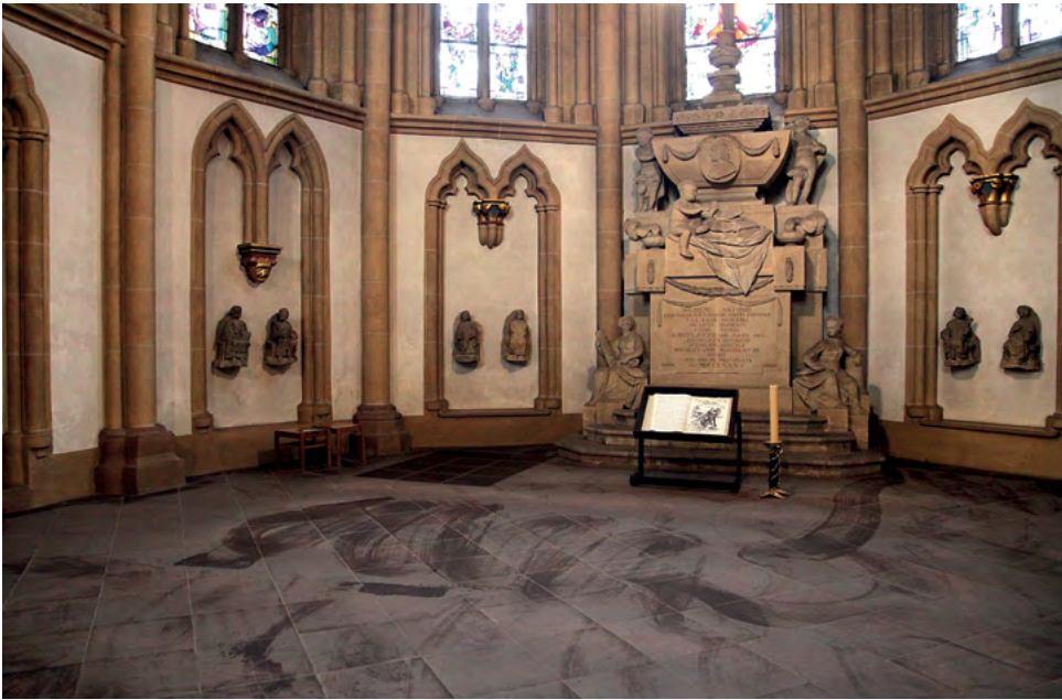
10 Paderborn, katedra, północne ramię transeptu, fragment.

Oczywiście nie każda średniowieczna symboliczna replika Grobu Świętego była wyposażona w takie łuki 18 . Właściwie są to przykłady dość odosobnione, ale ważny jest tutaj kierunek zależności – najwcześniejsze na Zachodzie dzieła sztuki z łukami w osli grzbiet wywodzą się lub odnoszą do Orientu.