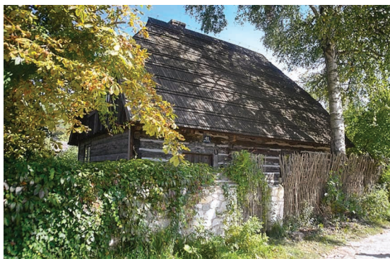
Dom Wiesława Juszcza i Jacka Sempolińskiego w Męcimerzu (dawna zagroda flisacka z 2. połowy XIX w.).