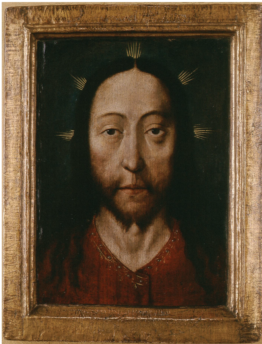
9. Albrecht Bouts, Święte Oblicze , ok. 1500. Kraków, Muzeum Narodowe w Krakowie – Muzeum Książąt Czartoryskich, nr inw. MNK XII-257.

odnoszącym się do malowidła ściennego, znajdującego się do dziś w krużgankach klasztoru augustianów-eremitów na Kazimierzu (il. 8): „[...] wchodząc do ambitu klasztornego od Kazimierskiej ulicy, która wiedzie na skałkę, są nad samymi drzwiami wewnątrz dwa obrazy malowania dawnego dziwnie pozorne i do nabożeństwa pobudzające [sic! – WM]: jeden Zbawiciela naszego w cierniowej koronie, jakoby nieledwie wszystkim krwią świeżą skro-