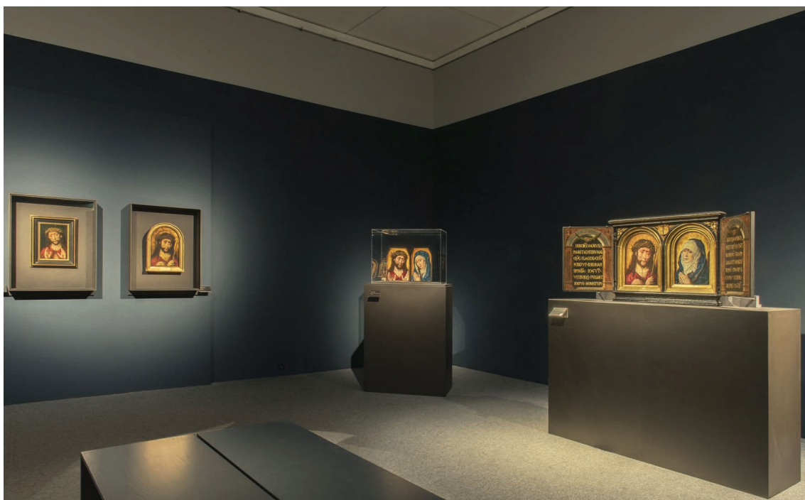
1–3. Widok wystawy w Akwizgranie, Suermondt-Ludwig-Museum.