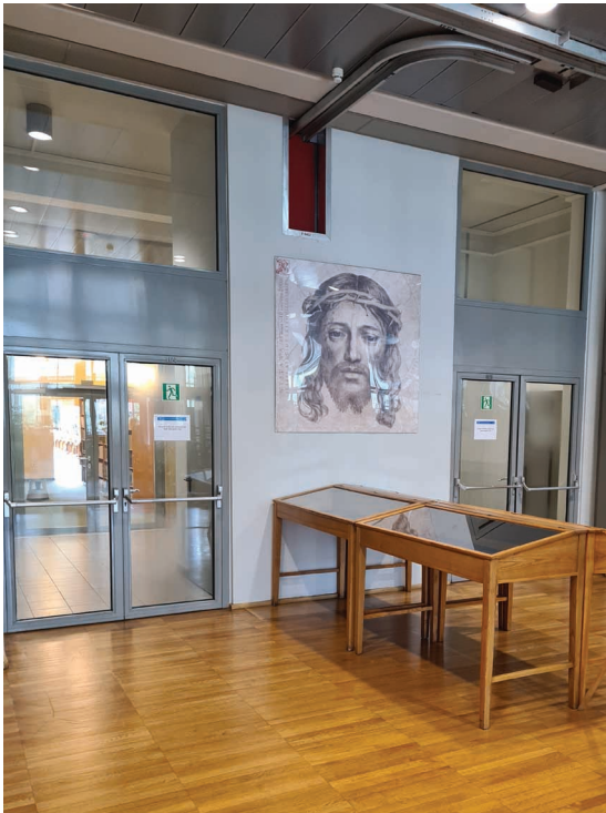
4. Kraków, Biblioteka Jagiellońska, klatka schodowa pierwszego piętra.

pośmiertnych 5 . Do koncepcji tej, jeśli pominąć odosobniony hołd złożony przez Aby Warburga 6 , sięgnięto dopiero w momencie, gdy studia nad społecznymi uwarunkowaniami powstawania i późniejszej „egzystencji” dzieł sztuki stały się uznanym tematem badawczym. Punkt zwrotny wyznaczył tu bodaj Horst Woldemar Janson, który Burckhardtowskie „zadanie” utożsamiał z pojęciem „funkcja” 7 . W tę