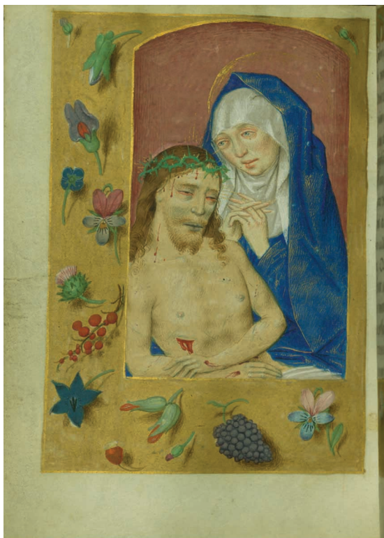
5. Opłakiwanie Chrystusa, miniatura, fol. 77 v. Godzinek (użytek rzymski) , Flandria, ok. 1490. Baltimore, MD, Walters Art Museum, nr inw. W.431.

Na wystawie Albrechta Bouts'a uderza, że choć wszyscy wielcy malarze flamandzcy XV w. malowali wizerunki Chrystusa, ale to malarz z Leuven wykoncytował w tym zakresie najwięcej formuł, powielanych następnie przez jego warsztat 19 .