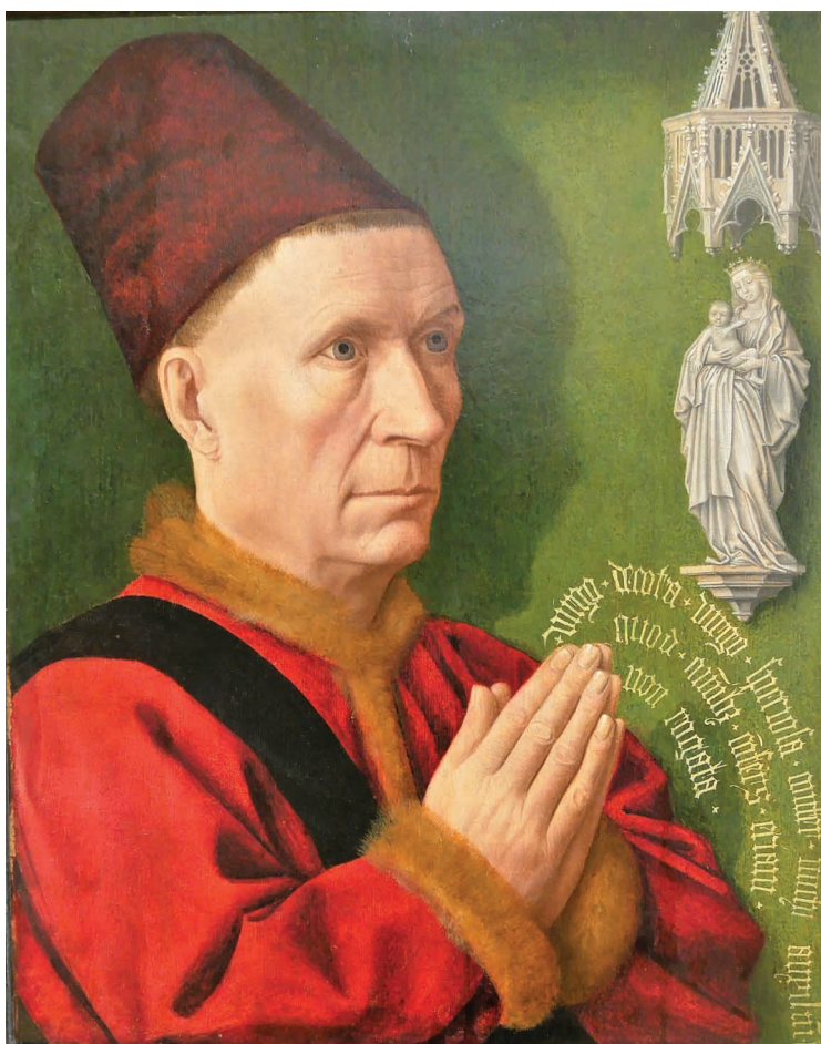
7. Mistrz z Saint-Jean-de-Luze, Dyptyk tzw. Hugues'a de Rabutin (fragment lewego skrzydła), ok. 1470. Dijon, Musée des Beaux-Arts, nr inw. D 1986-1-P (dep. Musée du Louvre).