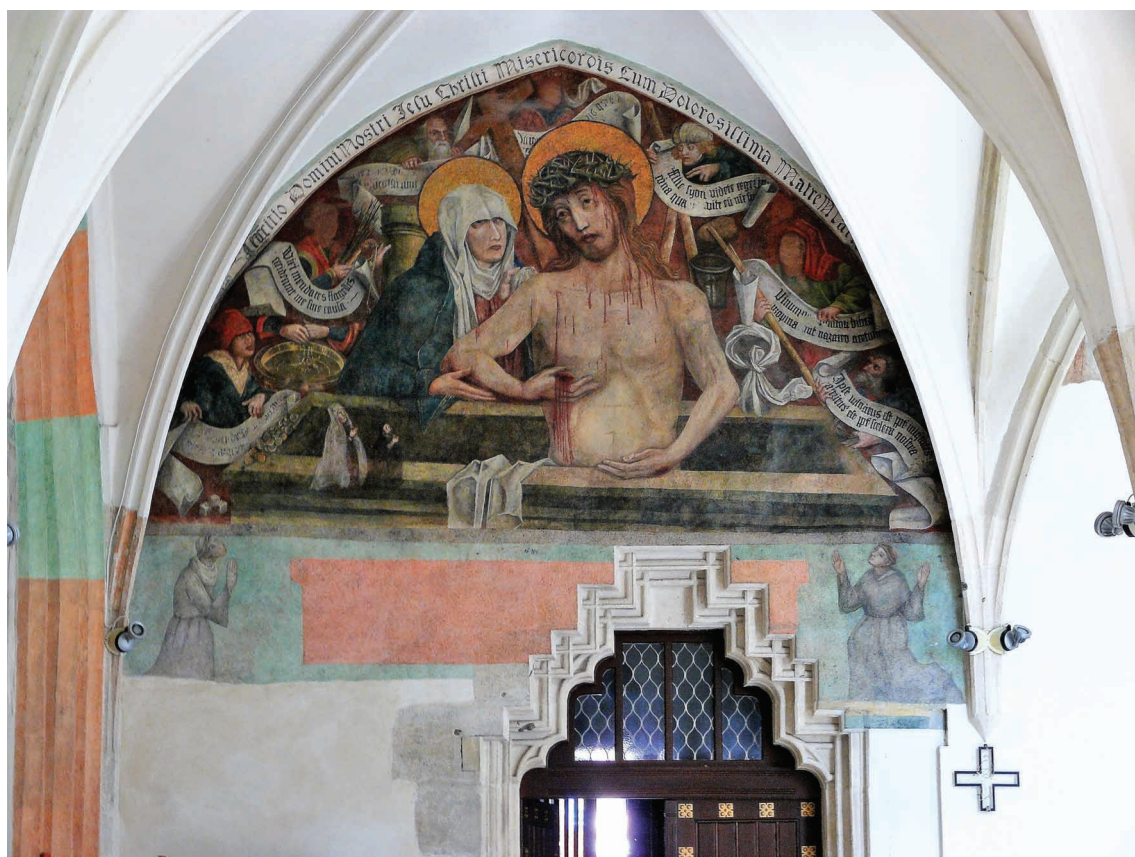
8. Mąż Bolesci i Matka Boska Bolesna, malowidło ściennie, przemalowane 1532–1534. Kraków, klasztor augustianów-eremitów, krużganki.

świadczone jest też zatrudnianie dodatkowych pracowników, którzy podtrzymywali produkcję w czasie nieobecności Albrechta w Leuven lub gdy pochłaniały go obowiązki publiczne. Raz wykoncypowane i zaakceptowane przez klientelę kompozycje pozostawały na stałe w repertuarze warsztatu.