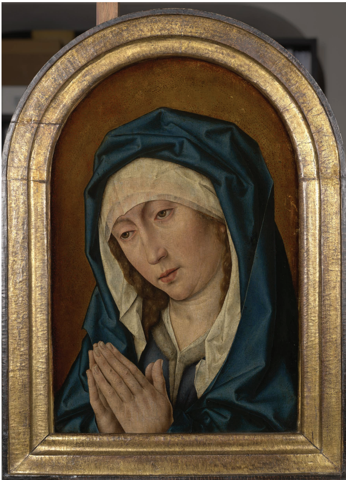
10. Albrecht Bouts, Mater Dolorosa, 1500/1510. Kraków, Muzeum Narodowe w Krakowie – Muzeum Książąt Czartoryskich, nr inw. MNK XII-258.